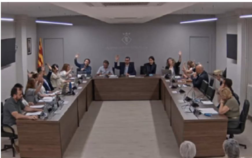
Els regidors i regidores van ocupar les seves cadires segons la distribució acordada per als propers quatre anys.

El primer Ple del mandat també va aprovar les retribucions que cobraran els càrrecs electes, així com les assignacions als grups municipals. Aquest va ser el punt que va generar més controvèrsia entre el govern i el grup del PP, que demanava poder cobrar més per dedicació. Es va aprovar una proposta transaccionada amb Per Alella Junts-CM segons la qual s'augmenta la dedicació al 45% de la jornada i l'assignació fins a 15.153€ anuals al portaveu del grup municipal amb més de 3 representants, mentre que els portaveus de la resta de grups de l'oposició la dedicació és del 30% i l'assignació de 10.102€.