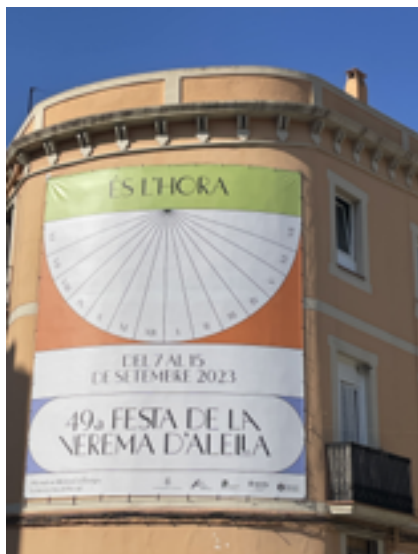
El cartell d'enguany és autoria d'Estudio Templao.

En aquesta edició el concurs d'aparadors serà substituït per una nova pro-