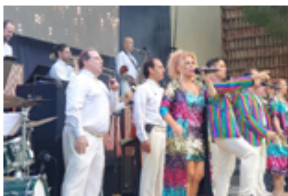
Concert i ball de gala amb la Maravella, l'1 d'agost