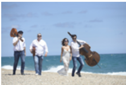
Havaneres amb Americanus, el 30 de juliol