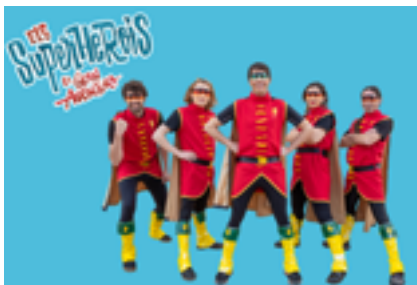
Concert Els Superherois, de Pop per Xics, el 29 de juliol