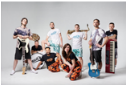
Concert d'Allioli, el 28 de juliol