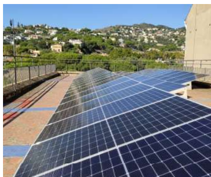
Els mòduls fotovoltaics s'han instal·lat a la coberta.

La instal·lació està formada per 62 mòduls fotovoltaics dels quals es preveu obtenir una producció de 32.422 kWh/any, el que pot suposar un estalvi energètic de més de 5.000 euros anuals. La distribució dels mòduls sobre la teulada s'ha realitzat de forma que