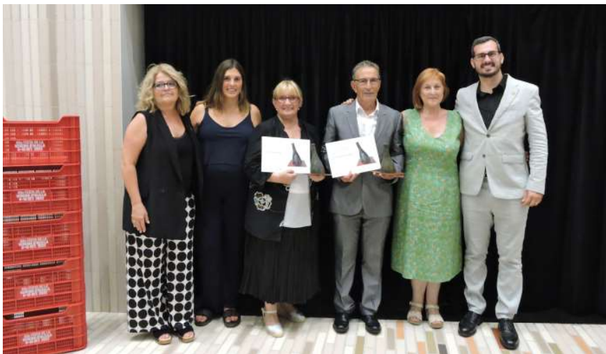
Els primer Premis Verema d'Alella es van lliurar l'11 de setembre a l'Espai d'Arts Escèniques Casal d'Alella.

L'alcalde d'Alella va destacar la dedicació i el treball realitzat per les dues persones, filles d'Alella, i que represen-