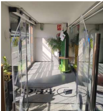
S'han instal·lat a l'entrada dos arcs de seguretat.

El nou sistema es basa en la tecnologia RFID (Radio Frequency Identification) i inclou el terminal d'autoprèstec, una estació de treball per a la gestió de préstec al taulell d'atenció al públic i dos arcs de seguretat a l'accés de l'entrada que, a més d'evitar el furt de documents, també permet controlar en tot moment