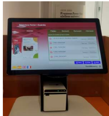
El terminal d'autoprèstec facilita les gestions.

La implantació del servei d'autoprèstec s'ha finançat amb una subvenció de la Diputació de Barcelona per a la reforma, millora i manteniment