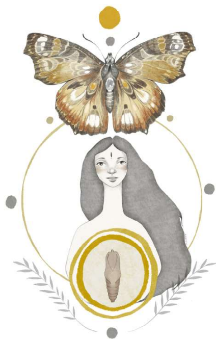
Il·lustració de LaiaSondagArt.

S'han programat una vintena d'activitats de dansa, teatre, música i cinema.