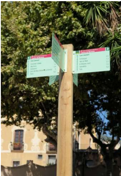
S'han instal·lat planells informatius.

S'han senyalitzat una quarantena de punts d'interès natural o patrimonial.