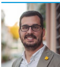
L'alcalde, Marc Almendro Campillo

Arriba el bon temps i el poble s'omple de vida després de dos anys d'afectacions constants a les activitats. I la gent participa en carrers i places de les activitats organitzades per l'Ajuntament o les associacions del poble, perquè hi ha moltes ganes de viure la vida.