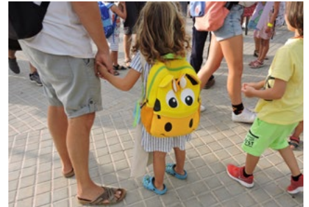
Els ajuts es poden demanar fins al 21 de juny.

A més, també com a novetat, els ajuts a l'escolarització de primer cicle d'infantil de 0 a 3 anys només poden sol·licitar-se per a infants que hagin estat matriculats a la Llar d'Infants Muni-