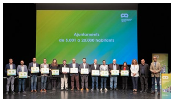
Alella en el Top10 dels ajuntaments amb maduresa digital.