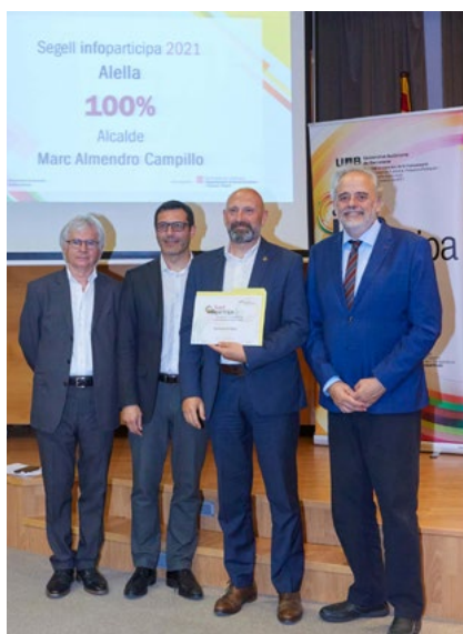
Acte de lliurament del Segell Infoparticipa.

En aquesta VI edició han estat guardonats 81 ens locals catalans repartits en set categories d'acord amb el nom-