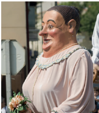
La festa se celebrarà el 15 de març a partir de les 17h.

La celebració començarà a les 17h a la Plaça de l'Ajuntament amb activitats per a infants i adolescents: tallers de titelles i pintures. A les 18h s'espera l'arribada de la geganta, acompanyada