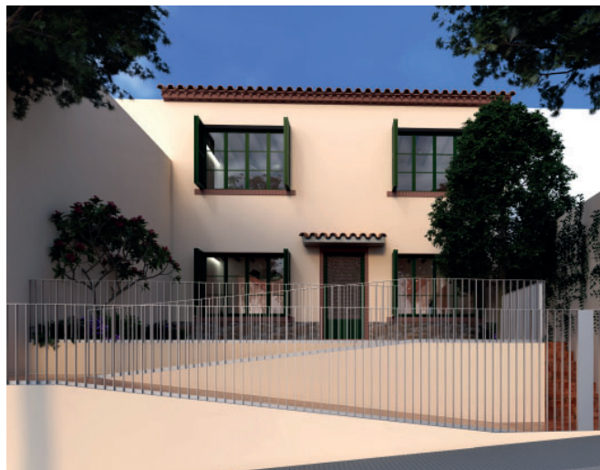
Imatge virtual de com està previst que quedi l'exterior de l'edifici.

L'Ajuntament va iniciar a mitjans febrer les obres de rehabilitació de l'edifici de les "Cases dels Mestres", situat al costat de les Antigues Escoles Fabra, per reconvertir-lo en habitatges socials. Les obres van ser adjudicades per Junta de Govern a l'empresa Construccions Deumal per un import de 358.039 euros i termini d'execució de 12 mesos.