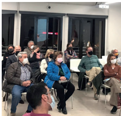
Les sessions es van fer en format presencial i virtual.

Més de 140 persones participen, de forma presencial o virtual, en les cinc sessions que van quedar enregistrades al canal de youtube de l'Ajuntament.