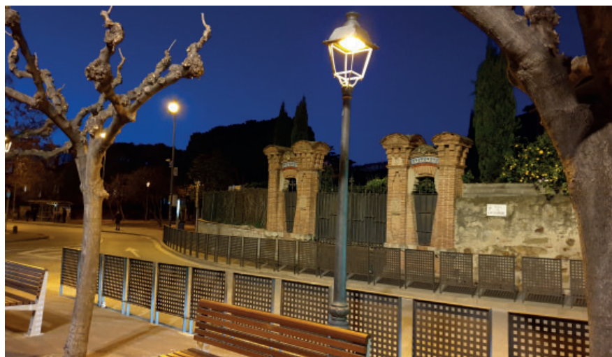
S'han substituït una seixantena de punts de llum del centre del municipi.

Els treballs han estat realitzats per l'empresa SECE SA, concessionària de l'enllumenat públic d'Alella, per un import de 42.000 euros. En concret s'han substituït els punts de llum d'una desena de carrers, parcs i places del municipi: plaça de Can Lleonart, Plaça de l'Ajuntament, parc del carrer Catalunya, parc dels Drets Humans, parc de Can Sors, plaça d'Antoni Pujadas, carrer de la Selva, carrer Llorer, l'aparcament