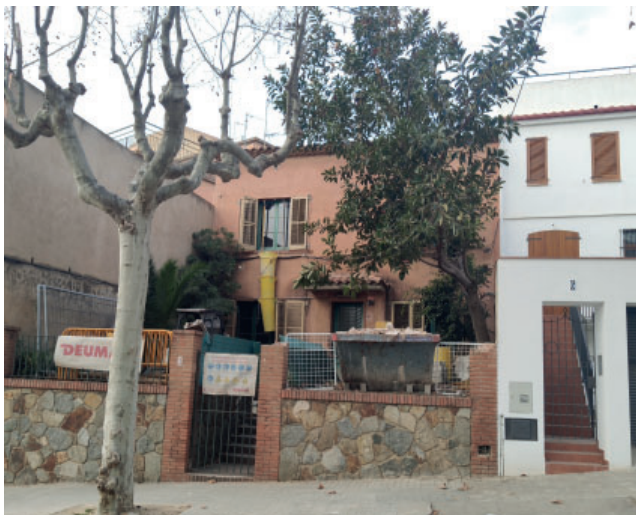
Les obres es van iniciar a mitjans febrer i tenen un termini previst d'un any.