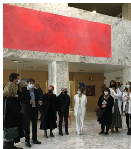
La mostra expositiva es inaugura el 19 de novembre.

L'exposició del projecte IN_CERT va arribar el 19 de novembre a l'Hospital Germans Trias i Pujol (Can Ruti), després d'inaugurar-se a Can Manyé el 29 d'octubre. Durant les setmanes vi-