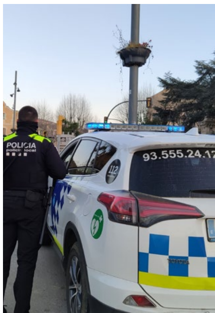
La Policia Local es va encarregar del desallotjament.

L'Ajuntament va ordenar el desallotjament mitjançant un decret d'Alcaldia per evitar situacions de risc.