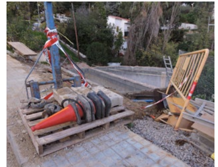
Es preveu enllestir les obres abans de final d'any.

El projecte contempla la impermeabilització, neteja i reparacions estructurals i superficials necessàries de l'interior i la instal·lació d'una nova cobertura amb una placa de guix armada. La cobertura mantindrà els dos accessos actuals, però s'instal·laran es-