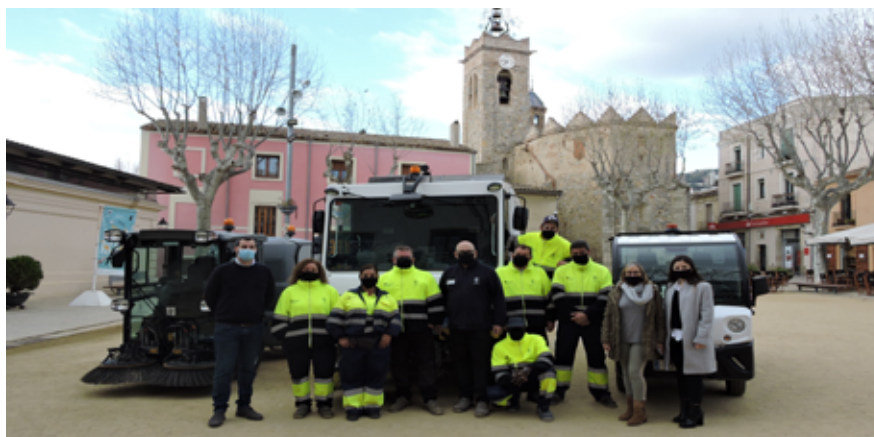
Foto de família de l'equip i els vehicles del servei de neteja viària i els vehicles.

A més del vehicle de neteja dels carrers del centre, l'empresa disposa d'un altre vehicle Dulevo, molt més gran, amb capacitat per recollir fins a 5.000 metres cúbics. Aquest vehicle s'utilitza