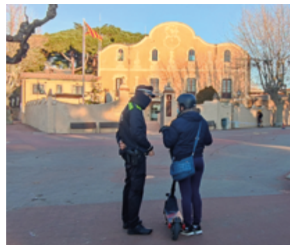
La nova normativa va entrar en vigor el 2 de gener.

El Reial Decret 970/2020, aprovat al novembre de 2020, modifica el Reglament General de Circulació i el Reglament General de Vehicles en matèria de mesures urbanes de trànsit. El text regula, entre altres, els requisits tècnics i les condicions dels vehicles de mobilitat personal (VMP), els quals passen a ser definits formalment com a