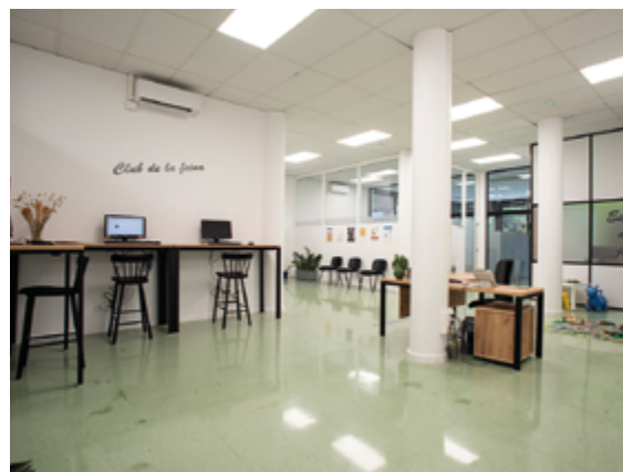
Les oficines de Serveis a les Persones s'han remodelat amb nous espais d'atenció.