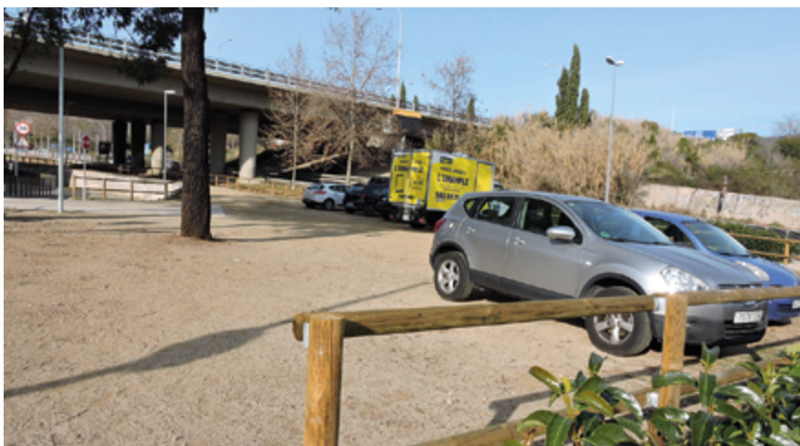
L'actuació a permès millorar l'estat general de l'entorn i ampliar la capacitat d'aparcament.

S'ha habilitat un ampli espai d'aparcament i s'ha adequat l'entorn.