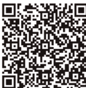
Recorregut de la Cavalcada

La Cartera Reial recollirà les cartes que els infants d'Alella han escrit als Reis Mags els dies 2, 3 i 4 de gener, de 11 a 14h i