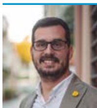
L'alcalde, Marc Almendro Campillo

El darrer Ple va aprovar el pressupost municipal per a l'any 2021. Com fa temps que expressem, ha estat una tasca molt complexa atesa la important reducció d'ingressos. El pressupost de 2021 és un pressupost COVID, és a dir, un pressupost afectat per l'agreujament de la crisi econòmica i social fruit de la pandèmia. Malgrat que finalment no s'ha confirmat cap dels pitjors escenaris amb els que treballàvem, aquesta reducció d'ingressos prevista s'ha situat a l'entorn dels 600.000 euros.