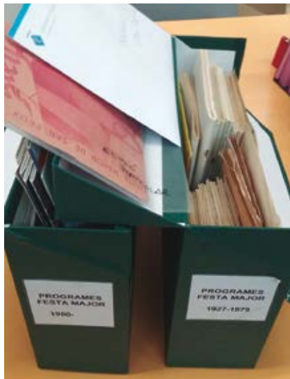
El material es va lliurar el 23 d'octubre per ser digitalitzat.

La major part dels programes de Festa Major compresos entre els anys 1927 i 2019 podran ser consultats a través d'Internet gràcies a la seva digitalització i inclusió en la plataforma Trenca-dís, un dipòsit digital de la Xarxa de Biblioteques Municipals que té per objectiu promoure i difondre la cultura local i preservar i facilitar l'accés a aquelles col·leccions úniques i valuoses de les biblioteques.