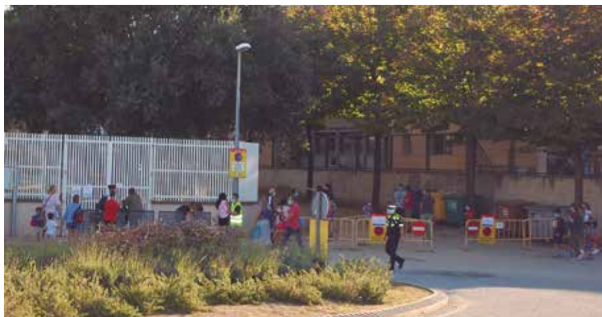
Famílies, amb les mascaretes pertinents, esperant l'obertura de les portes d'infantil de l'Escola Fabra.

L'inici del curs escolar 2020-2021 ha estat excepcional. El primer curs que hem iniciat després de la crisi del coronavirus implicava la tornada de 1.702 infants i adolescents d'Alella a les aules després de gairebé mig any. Per fer aquest retorn el més segur possible, el Departament d'Educació va dictar, juntament amb el de Salut, una sèrie de directrius i mesures de seguretat i prevenció de contagis que els diversos centres escolars han aplicat a l'hora de dissenyar els seus plans de reobertura. Cal tenir en compte que les recomanacions estan en contínua revisió i poden