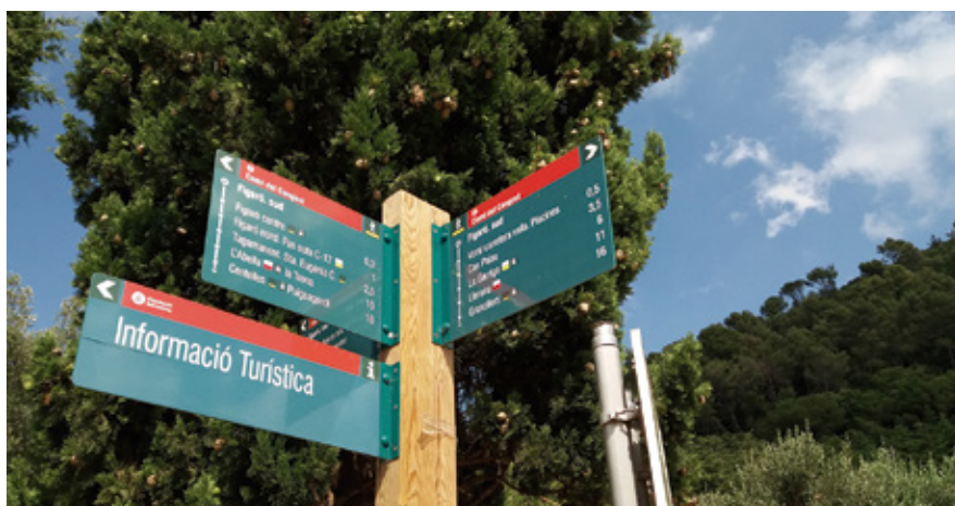
Al projecte de senyalització s'han establert una quarantena de punts.

S'ha ideat un recorregut circular que unirà les diferents fonts del municipi.