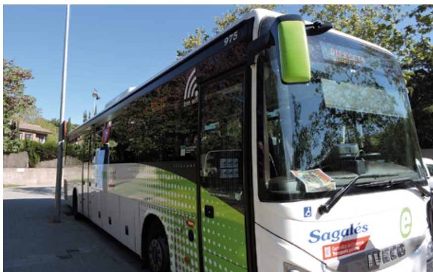
Els nous horaris de pas de les línies e19 i 648 van entrar en vigor el passat dilluns 2 de març.

Les dues línies que connecten amb Barcelona, la e19 i la 648, amplien els serveis amb sis expedicions més per sentit.