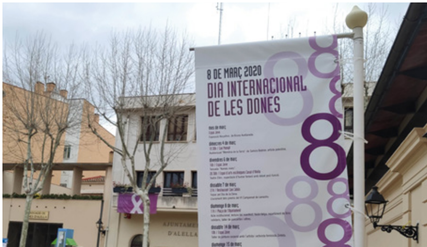
Amb la moció l'Ajuntament se suma al Decàleg per a la construcció de ciutats feministes promogut al Baix Llobregat.

El Ple aprova una moció per promoure la igualtat i evitar la discriminació de les dones i de les persones del col·lectiu LGTBI.