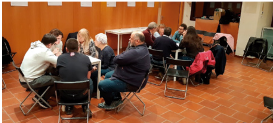
Més d'una trentena de persones, de 19 entitats, van participar a la jornada participativa que es va fer el 18 de gener.

El Ple del 27 de febrer va aprovar inicialment les normes marc que han regir, a partir d'ara, les relacions de l'Ajuntament amb les entitats del municipi: el Reglament de Registre Municipal i el Reglament de Suport i Recursos per a les associacions i col·lectius d'Alella. L'objectiu d'aquests dos reglaments és crear una normativa comuna que afavoreixi la igualtat d'oportunitats i d'accés als recursos. El Reglament de Registre Municipal es va aprovar amb el vot a favor de tots els grups excepte el d'AA-CUP, que va votar en contra, i