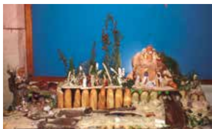
Primer premi escoles i entitats.