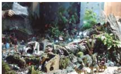
Primer premi categoria infantil.

de creacions que s'han presentat enguany han resultat premiats en alguna de les categories: infantil; familiar; escoles i entitats, residències i comerços.