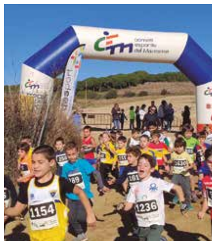
El bon temps va acompanyar el Cros d'Alella.

El 12è Cros d'Alella va batre rècords de participació amb un total de 349 atletes —68 d'Alella— a les diferents categories de la competició, puntuables per al circuit maresmenc d'atletisme. A aquesta xifra, cal afegir una vuitantena més d'aficionats que van voler sumar-se a la cursa solidària Sumem, organitzada per primera vegada a la tro-