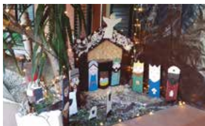
Primer premi entitats, residències i comerços.