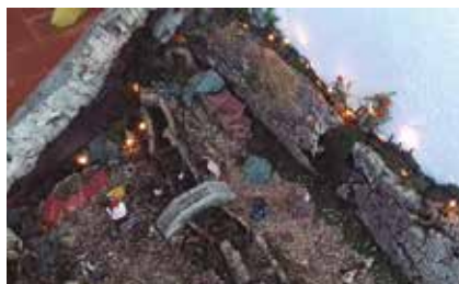
Primer premi categoria familiar.