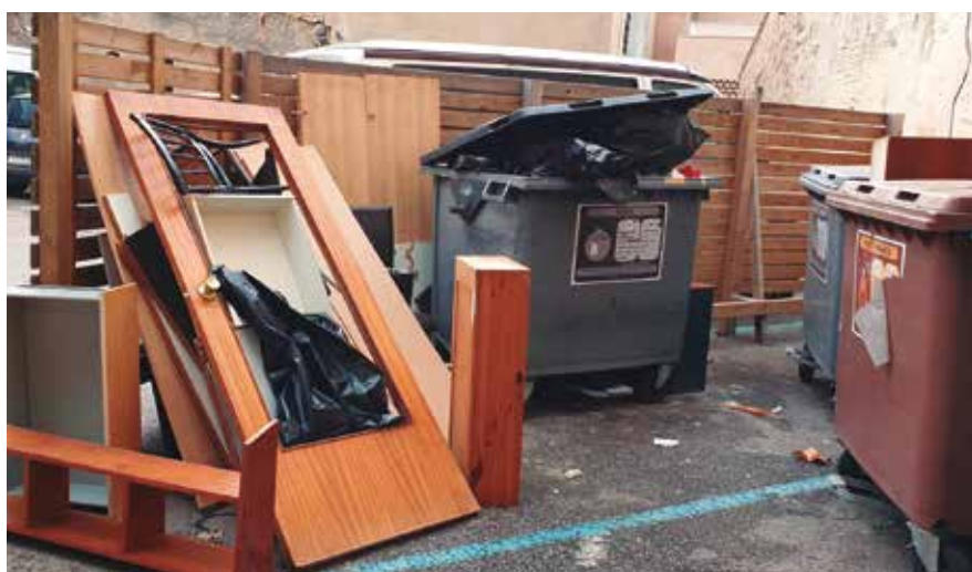
Aquesta és una imatge massa habitual en algunes àrees de recollida del municipi.

L'Ajuntament ha posat en marxa una campanya de sensibilització per evitar la presència de voluminosos abandonats al carrer.