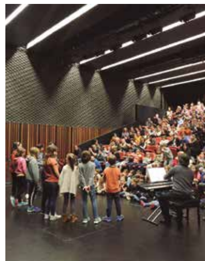
Imatge de la sala durant la cantada de nades.

cinema en el primer trimestre de l'any. Més informació i compra d'entrades a www.alella.cat/espaialella .