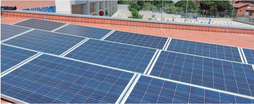
Plaques solars a l'Escola La Serreta d'Alella.

Per tal de facilitar a la ciutadania la tramitació, l'Ajuntament ha modificat les instruccions que cal seguir per a la instal·lació de plaques fotovoltaïques d'autoconsum que aprofitin l'energia solar, en règim de comunicació prèvia. El canvi consisteix en l'ampliació de 16 a 35 m 2 del límit màxim de superfície de la instal·lació per poder acollir-se a la comunicació prèvia i no haver de demanar llicència.