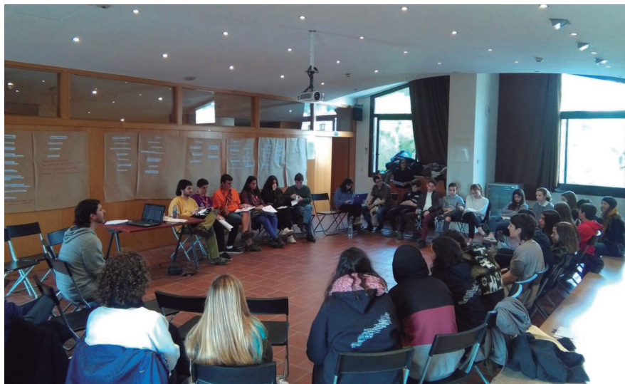
L'Ajuntament ha iniciat un procés de revisió dels instruments i òrgans de participació ciutadana.

L'Ajuntament inicia un procés per revisar els instruments i òrgans participatius per tal de fomentar la participació corresponsable i inclusiva.