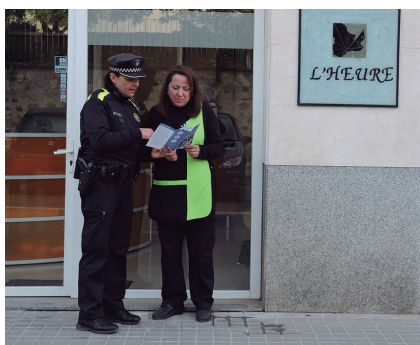
La campanya preventiva es farà fins als volts de Nadal.

La regidoria de Seguretat Ciutadana ha posat en marxa aquest mes de novembre la campanya anual de seguretat als