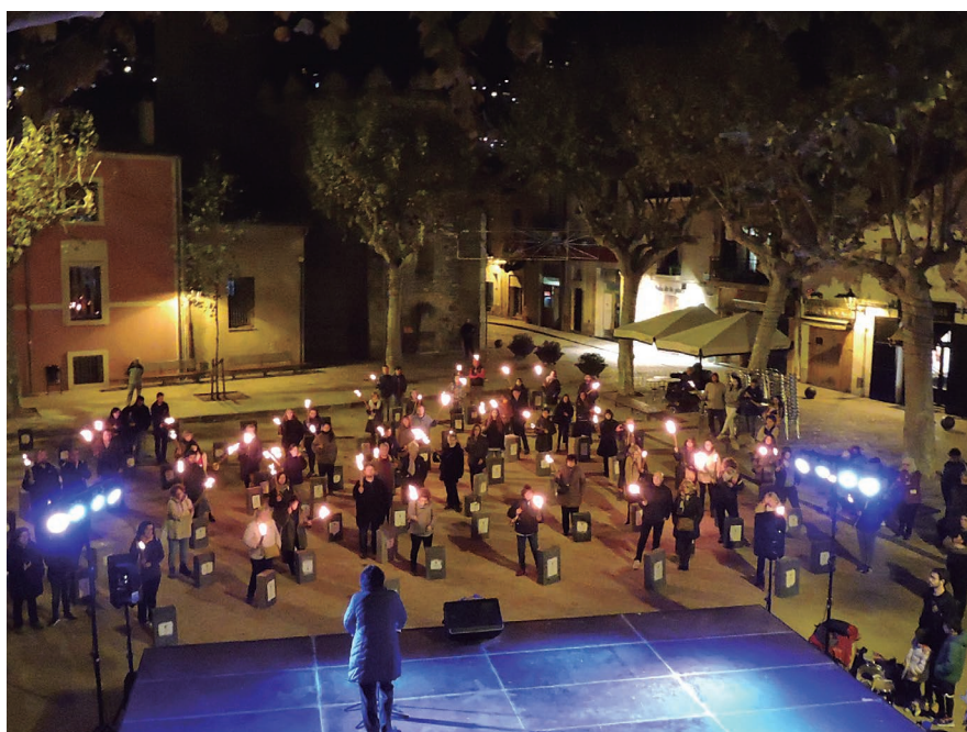
La Plaça de l'Ajuntament va acollir l'acte institucional del 25N.

L'Ajuntament té previst adherir-se al protocol comarcal per a l'abordatge de la violència masclista i està acabant d'enllestir un protocol d'actuació als espais d'oci nocturn.