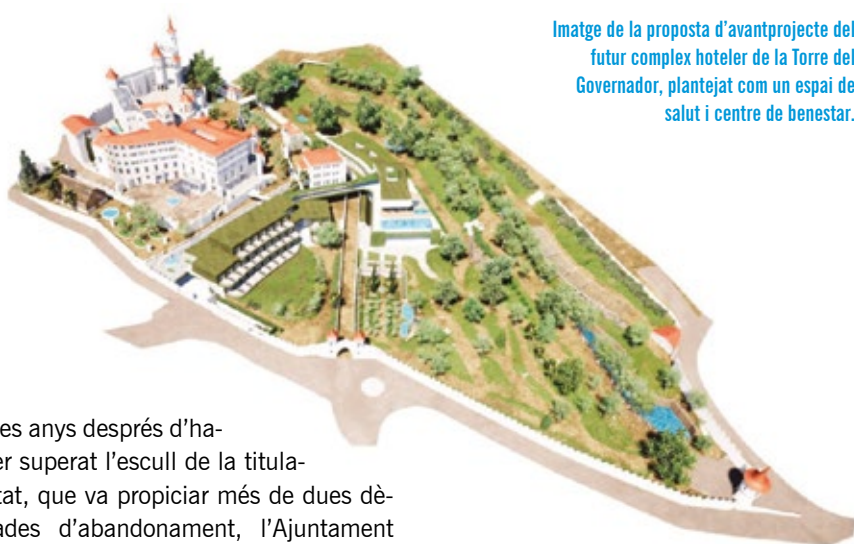
Imatge de la proposta d'avantprojecte del futur complex hotelier de la Torre del Governador, plantejat com un espai de salut i centre de benestar.

L'Ajuntament aprova inicialment el Pla de Millora Urbana que dona forma al futur complex hotelier.