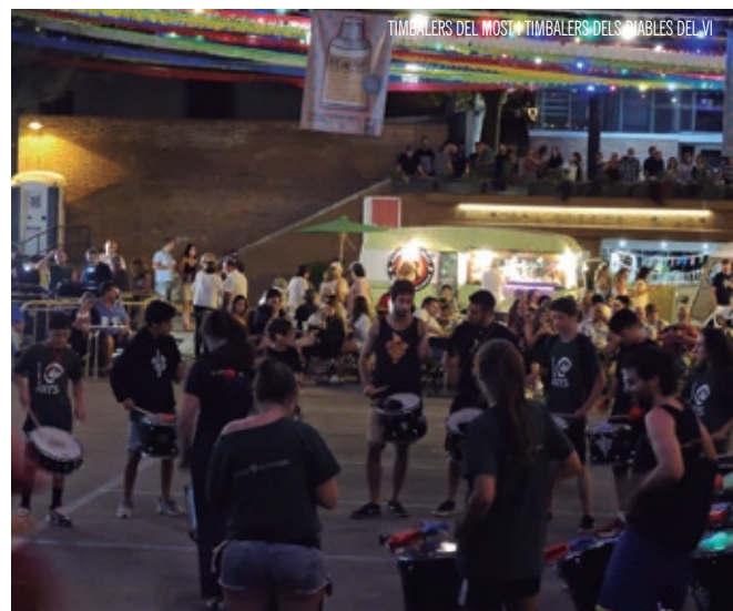
TIMBALERS DEL MOSTI, TIMBALERS DELS TABLERS DEL VI