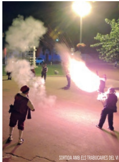
SORTIDA AMB ELS TRABUCAIRES DEL VI