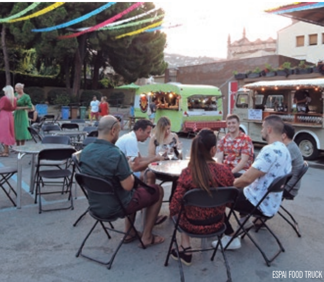
ESPAI FOOD TRUCK