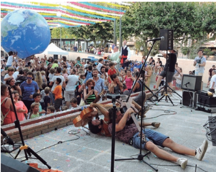
El grup infantil Xiula va fer gaudir de valent a la canalla i els seus acompanyats a l'Hort de la Rectoria.

Alella va viure els primers dies d'agost al ritme festiu que marca la Festa Major de Sant Feliu, un moment per sortir al carrer i viure bons moments a l'espai compartit. Places i carrers es van omplir de gent amb les més de 40 activitats programades per a tots tipus de públic.