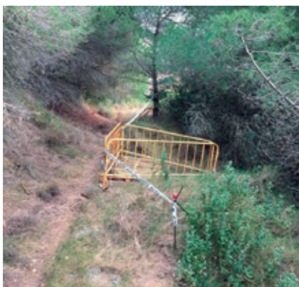
S'han revisat un total de 35 pous dels quals 25 no complien les mesures de seguretat adients.