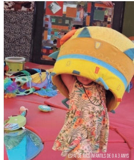
ESPAI DE JOCS INFANTILS DE 0 A 3 ANYS