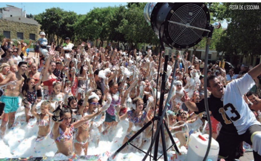
FESTA DE L'ESCUMA