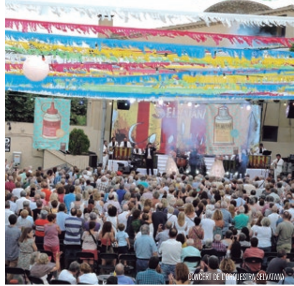
CONCERT DE L'ORQUESTRA SELVATANA