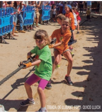
TIBADA DE LLIBANT.