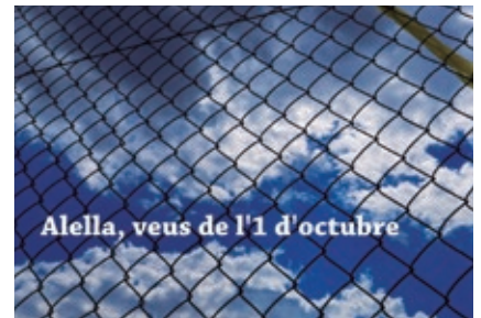
El documental es projectarà la 1a quinzena d'octubre.

L'objectiu d'aquesta iniciativa —que es complementa amb un recull escrit amb entrevistes, fotos i testimonis que està preparant la Revista Alella — és posar en comú les vivències personals dels veïns i veïnes d'Alella a la jornada de l'1 d'Octubre de 2017, per tal que puguin quedar recollides en un futur a l'arxiu