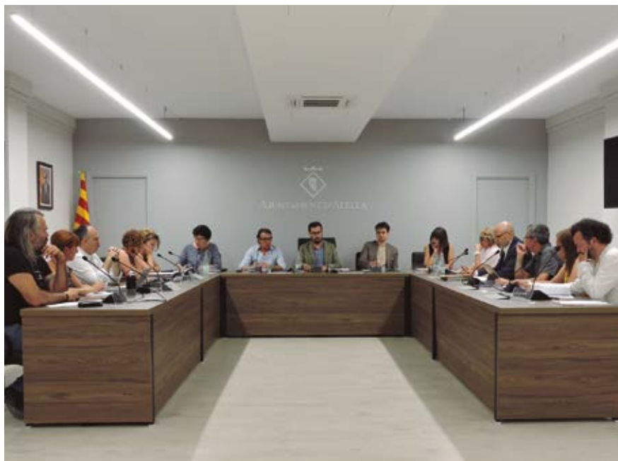
Els regidors i regidores van ocupar les seves cadires segons la distribució acordada per als propers quatre anys.

Aquest primer Ple del mandat també va servir per aprovar les retribucions que cobraran els càrrecs electes, així com les assignacions als grups municipals (veure el quadre). Aquest va ser el punt que va generar més controvèrsia entre el govern i l'oposició. JxCAT, Gd'A, Ciutadans i AP-PSC van votar en contra per considerar que caldria incrementar el component fix de 200€ anuals de l'assignació dels grups municipals per tal que, segons van dir, fos més equitativa per a tots els grups municipals amb independència dels número de regidors. A aquest component fix cal afegir un component variable que és de 305€ per cada regidor del grup.