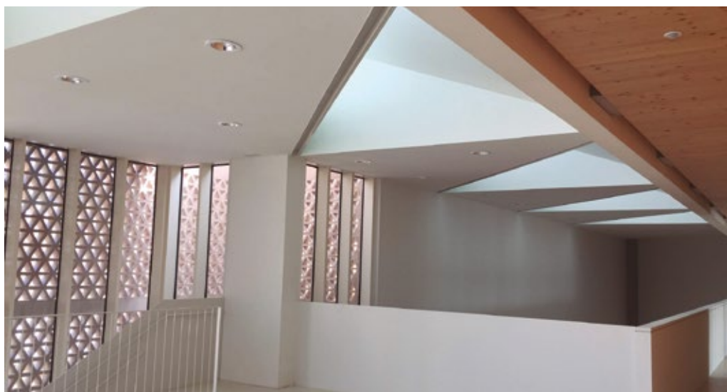
Vista interior des de la segona planta.

El diumenge 19 de maig serà un bon moment per poder descobrir l'espai en família, assistint a l'espectacle teatral La nena dels Pardals , amb la Tresca i la Verdesca. El divendres 31 de maig, l'espai estarà reservat per al col·lectiu de més de 65 anys amb la representació teatral Alguns neixen estrellats , amb l'actor mataroní Joan Pera. Aquesta activitat s'emmarca dins de les Jornades de la Gent Gran Activa. Podreu trobar tota la informació a l'Agenda Cultural www.alella.cat/cultura .