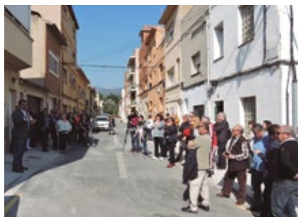
Inauguració de la reurbanització dels carrers.