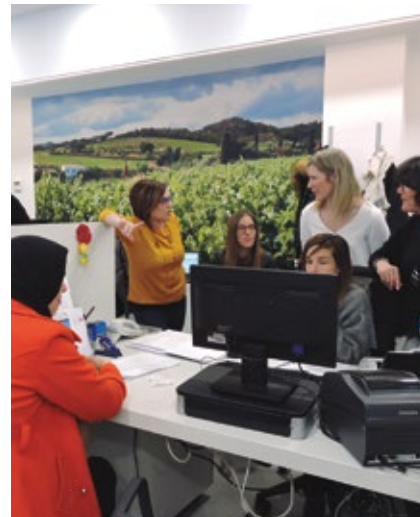
El sistema permetrà millorar la tramitació electrònica.

Inicialment, i fins la seva implantació definitiva, pot comportar un alentiment en la tramitació i incrementar el temps d'espera a l'Oficina d'Atenció a la Ciutadania.