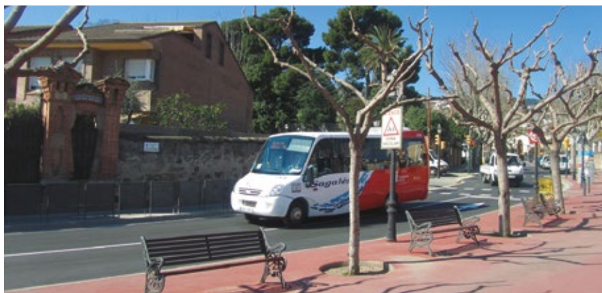
La prova pilot es podria posar en marxa, si la Generalitat autoritza el servei, en el segon trimestre de l'any.

L'Ajuntament ha demanat a la Generalitat fer arribar algunes expedicions de la línia Alella-Circumval·lació fins a l'Hospital Germans Trias i Pujol.