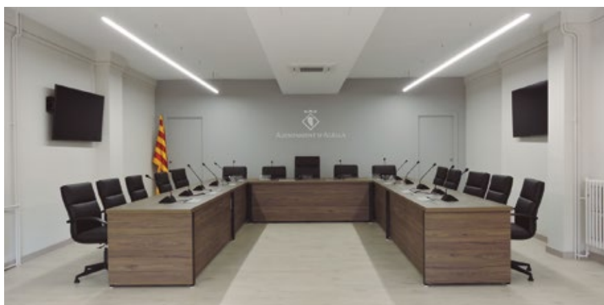
El Ple de febrer va estrenar la reforma de la Sala de Plens que no canviava d'imatge des de fa més de 30 anys.

La Sala de Plens s'ha renovat per dintre i per fora. El Ple de gener va posar en marxa el sistema de vídeo actes i les transmissions en vídeo i la sessió de febrer va estrenar una sala totalment reformada. Les obres han consistit en la instal·lació de parquet al terra, la pintura de la sala i la renovació de tot l'enllumenat.