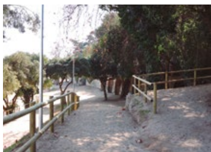
Millores a la zona verda de La Gaietana.

L'Ajuntament va inaugurar el 2 de març els treballs de reurbanització dels carrers Canonge i La Font i la remodelació de la zona verda de La Gaietana. L'actuació ha permès de millorar l'accessibilitat en aquest sector, amb la reconversió dels carrers en vials de prioritat invertida i voreres més amplies. Els treballs es van adjudicar a Cosplan Obras y Servicios Laantit SL per un import de 228.446€.