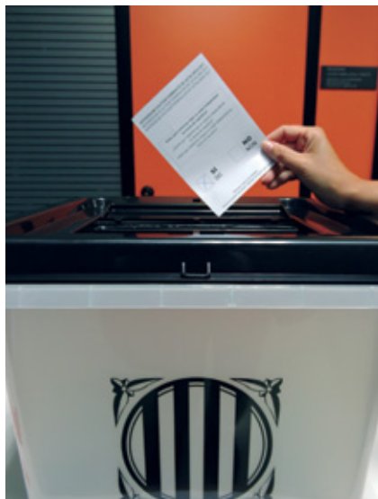
El material es pot enviar fins al 21 de desembre.

L'Ajuntament anima la ciutadania a participar en la recopilació de fotografies, escrits i testimonis de les vivències personals de l'1 d'Octubre. Per tal de poder fer aquest treball, la Regidoria de Participació ha encarregat a la revista Alella la feina de recollida de material fotogràfic i escrit i a una productora audiovisual, Kineina, l'elaboració d'un documental que es va començar a enregistrar als actes de commemoració del primer aniversari.