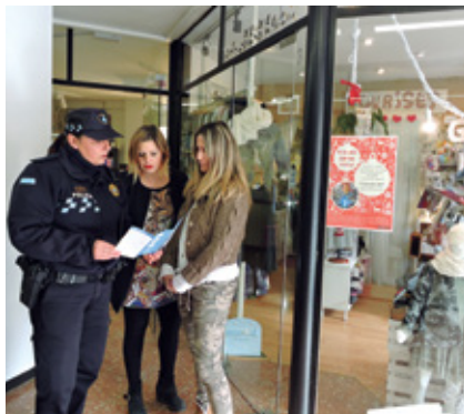
La campanya preventiva finalitzarà després de Reis.

Un any més, l'àrea de Civisme i Seguretat Ciutadana posa en marxa la campanya anual de seguretat als comerços, coincidint amb l'època nadalenca. La mesura té l'objectiu de prevenir els actes delictius que s'accentuen amb l'increment de l'activitat comercial i l'afluència de gent al carrer. La campanya de seguretat als comerços s'iniciarà a principis de desembre i està previst que s'allargui fins a després de Reis.