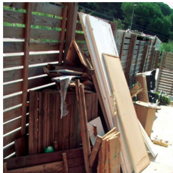
Una imatge bastant habituals als darrers mesos a Alella.

L'Ajuntament també fa recollida de restes vegetals de mida petita porta a porta. En aquest cas, cal sol·licitar la saca per dipositar les restes a l'Oficina d'Atenció a la Ciutadania i deixar-la, prèvia concertació telefònica al 937905560, davant de la porta de casa els dies de recollida, que són dilluns, dimecres, divendres i diumenge. Només es poden recollir mitjançant aquest sistema les restes de mida petita no llenyosa, com fulles, branques de tamany reduït, gespa o males herbes. Els troncs, branques mitjanes i grans s'han de portar a la deixalleria. Entre gener i octubre s'han realitzat una mitjana 107 recollides al mes. Amb tot, en aquest període també s'han realitzat 483 recollides de restes de poda no programades en àrees de contenidors i el seu entorn.