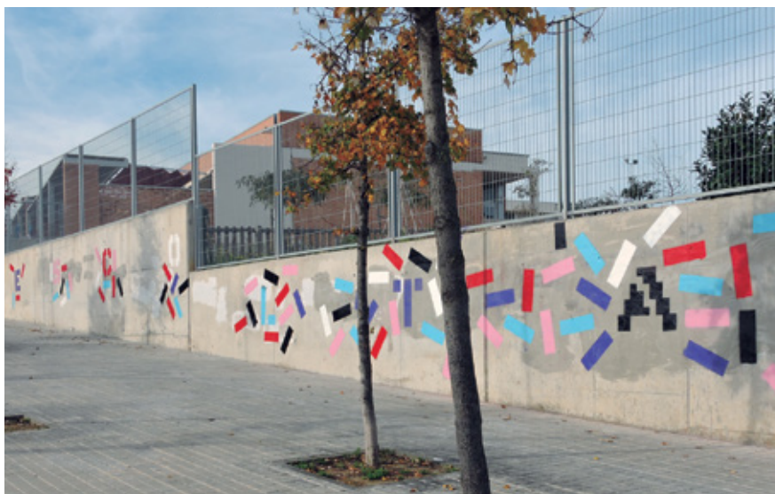
El mural es va començar a pintar el 12 de novembre, però els dies de pluja han fet endarrerir l'acabament.

realització d'obres d'art a partir d'instruccions. La diferència és que en aquest cas s'incorpora un element sonor que és el que dóna les instruccions. La idea és anar generant un patró de funcionament i tot el procés serà enregistrat en vídeo. "L'hem programat perquè sigui al·leatori, no sabem que sortirà, tenim una certa idea perquè hem generat un patró que té unes certes característiques i creiem que s'acabarà veient una figura semigeomètri-