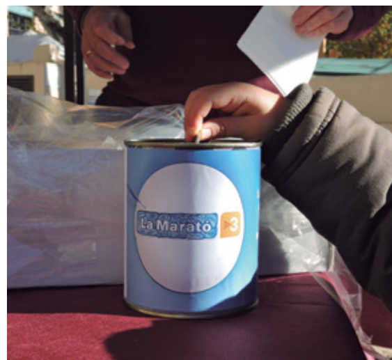
La guardiola de La Marató estarà a molt punts d'Alella.

El gruix de les activitats nadalenesques se centren enguany en el cap de setmana del 15 i 16 de desembre. És el cap de setmana de la Fira de Nadal i s'aprofita aquest esdeveniment per organitzar la major part dels actes programats per l'Ajuntament i per les entitats per recaptar diners per a La Marató de TV3.