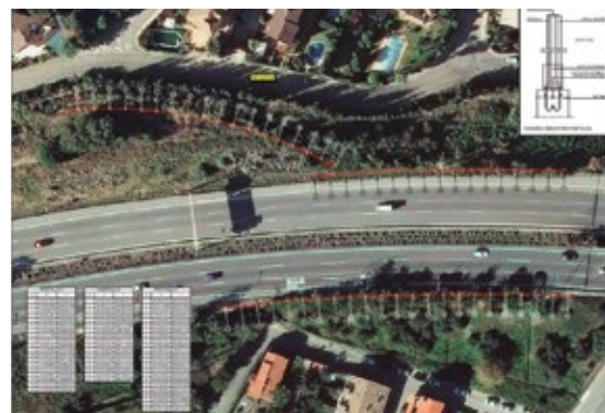
Imatge dels tres trams de pantalles.

La instal·lació de les pantalles acústiques a l'autopista és una demanda de l'Ajuntament i d'una part del veïnat d'aquesta zona. La redacció i exe-