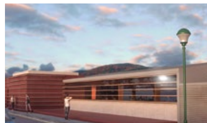
Imatges virtuals de la futura ampliació del Complex.

La tramitació de la modificació està a punt d'arribar al seu fi, després que el Ple del 25 d'octubre aprovés un text refós amb les correccions indicades per la Comissió territorial d'Urbanisme de Barcelona, el què dona llum verda a l'inici de les obres de l'ampliació del Complex i de la caldera de biomassa.