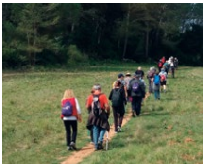
A la passejada participen 50 persones a cada sortida.

Per tercer any, l'Ajuntament se suma al cicle de passejades “A cent cap als 100”, una iniciativa promoguda per la Diputació en la qual participen una setantena de municipis, amb l'objectiu de fomentar l'exercici, intercanviar coneixements sobre la natura i afavorir les relacions entre les persones més grans de 60 anys. Aquesta temporada, Alella compartirà el camí amb Caldes de Montbui, Mollet del Vallès i Puig Reig. Com a cloenda es realitza una trobada conjunta en la qual participen tots els municipis i en la què només poden assistir aquelles persones que hagin realitzat un mínim de 3 sortides.