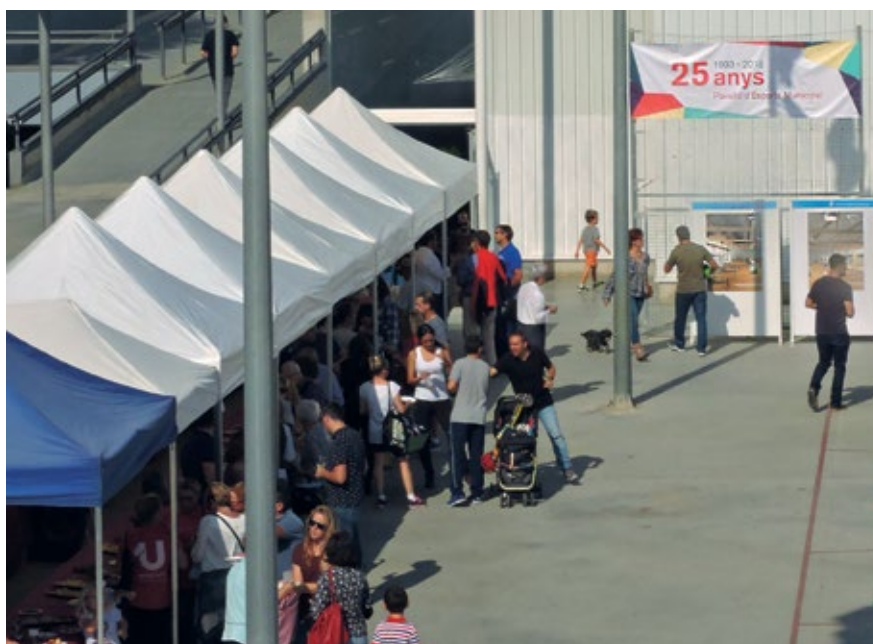
La celebració va cloure amb un vermut popular.

L'objectiu de la modificació, aprovada en el Ple de març, és reconvertir en zona d'equipaments una superfície de més de 1.000 m 2 que ara estan qualificats com a espais lliures situats a la zona de La Vera, entre el Complex