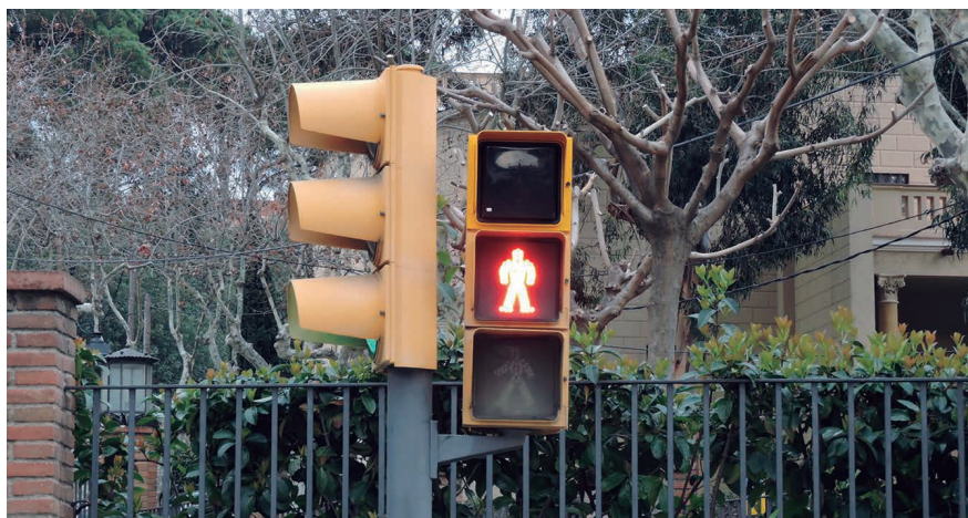
L'Ajuntament ha invertit més de 17.700 euros en l'adaptació dels semàfors amb el sistema d'avis per a invidents.

La iniciativa, duta a terme per l'àrea de Serveis Municipals, respon a la petició expressada per una veïna del municipi, que ja disposa del comandament facilitat per l'ONCE, i té per objectiu facilitar els desplaçaments de les persones invidents del municipi i també afavorir que les persones d'aquest