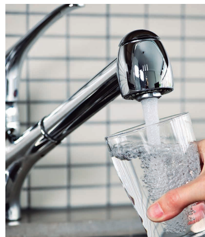
Des de mitjan març l'aigua té un gust diferent.

La concessionària té previst retornar a les vies habituals d'abastament quan es restableixi el funcionament de la dessalinitzadora del Llobregat, que ha estat malmesa pels temporals marítics.