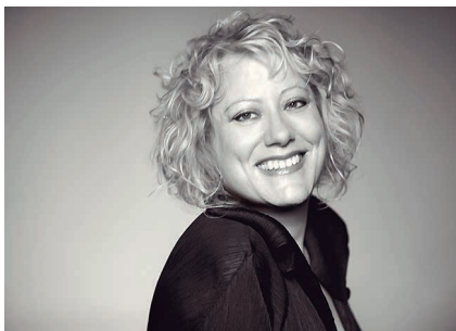
Marina Rossell actuarà el 25 de maig.

Can Lleonart té dos convidats excepcionals al Cicle de Músiques del Món del programa de primavera: Joan Miquel Oliver i Marina Rossell. El que va ser fundador, compositor i guitarrista d'Antonia Font presentarà el nou àlbum Atlantis el 4 de maig a les 21h. Marina