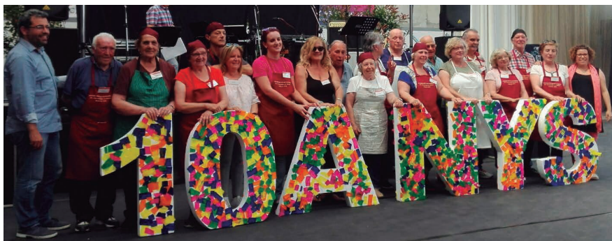
Una imatge dels voluntaris i voluntàries de l'arròs al final de 76è Dinar d'Homenatge a la Gent Gran de l'any passat.

El recull de Relats des d'Alella arriba a