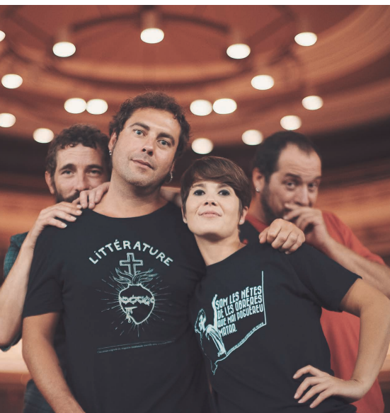
“Ovidi 4”, espectacle poètic per començar.

Diferents espais públics i privats es convertiran en escenari d'activitats i espectacles poètics.