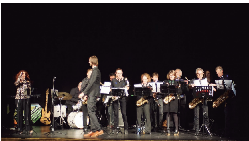
La Bas Kisjes Big Band actuarà el 7 de juliol als Jardins de Cal Marquès.