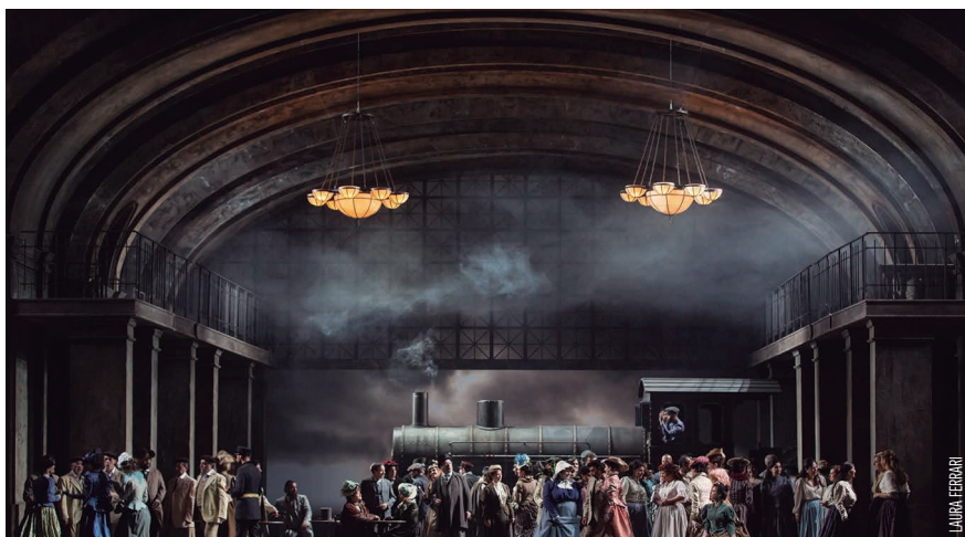
El Liceu a la Fresca porta a Alella la projecció de l'òpera "Manon Lescaut", el 16 de juny a la Plaça de l'Ajuntament.