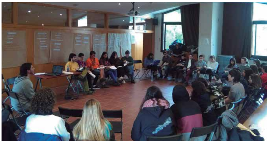
El Pla Local d'Adolescència i Joventut substitueix al Pla Local Jove aprovat l'any 2013.

A partir d'aquests tres pilars es proposen 50 actuacions per tal de donar compliment als objectius que planteja el Pla. Les accions proposades tenen com a principal missió garantir als i les joves l'accés universal i normalitzat als múltiples recursos presents a l'entorn immediat, per tal que puguin escollir i construir en llibertat i igualtat d'oportunitats el seu projecte personal i col·lectiu, a la mida dels seus interessos i prioritats. Al mateix temps, es pretén generar eines que puguin utilitzar joves i adolescents en la recerca de solucions per als seus problemes i mancances, especialment aquells que fan referència a la seva autonomia real i exercint tots aquells drets que es deriven de la condició de plena ciutadania.