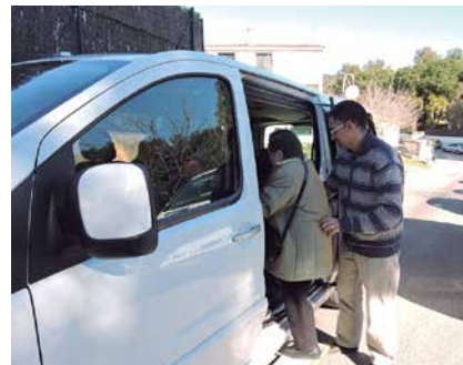
El servei va tancar l'any amb 145 usuaris i usuàries.

Aquest increment constant de viatges i viatgers demostra la utilitat d'un servei que es va posar en marxa l'any 2010, com una iniciativa pionera al Maresme, a partir d'un conveni signat amb el col·lectiu de taxistes per tal de facilitar els desplaçaments a les persones majors de 65 anys i/o amb diversitat funcional, física o sensorial. L'any 2013 es va ampliar a totes les persones empadronades a Alella però, en aquest cas, amb un límit de 6 viatges anuals. L'usuari paga 2€ per trajecte i l'Ajuntament assumeix els 4€ restants. El servei funciona de dilluns a divendres, de 7 a 20h, i per fer-ne ús cal trucar amb antelació a l'Ajuntament (93552339).