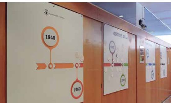
La línia del temps de la Riera està instal·lada a Can Lleonart.

S'han programat diferents trobades participatives i altres activitats comunitàries com una línia del temps perquè tothom pugui aportar vivències i experiències a l'entorn d'aquest espai.