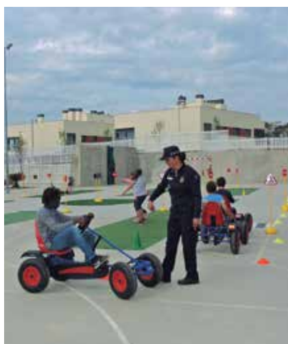
Circuit de karts permet ensenyar als alumnes els senyals de trànsit més rellevants i sortida en bicicleta dels alumnes de 6è de La Serreta per millorar la seguretat.