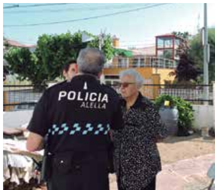
La Policia Local ha visitat mig centenar d'habitatges.

La Policia Local d'Alella i els Mossos d'Esquadra han visitat una seixantena d'habitatges durant la campanya porta a porta per prevenir robatoris que van dur a terme entre finals d'abril i principis de juny. La major part de les visites van ser realitzades per l'equip de proximitat de la Policia Local i es van centrar principalment en el barris de l'Eixample