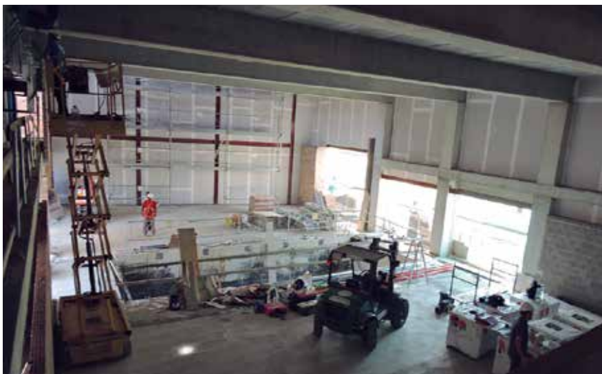
Imatge de les obres de l'interior de l'edifici durant una visita realitzada per regidors i regidores de l'Ajuntament al maig.

La votació popular del nom ha servit per posar a prova el vot electrònic a Alella, mitjançant un sistema que garanteix la protecció de dades, que no hi ha duplictat de vot i que totes les votacions emeses són de persones residents a Alella, de 16 anys o més que són els requisits requerits per formar part del cens de la consulta.