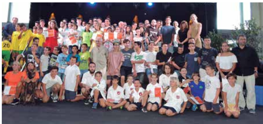
Foto de família de tots els esportistes finalistes i premiats a la quarta edició dels premis Alella Valora l'Esport.