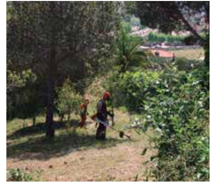
Enguany es farà manteniment de totes les franges.

Paralel·lament, l'Ajuntament ha adjudicat a l'empresa Estudios y Contratas Silvicolas SL els treballs de neteja i manteniment de les franges perimetrals de protecció contra incendis forestals als barris de Can Magarola, Font de Cera, Alella Parc, Mas Coll, Coma Fosca, Can Comulada i Nova Alella-Cal Baró. Aquests treballs es realitzen cada dos anys a tots els nuclis vulnerables i cada any als barris de Can Comulada i Nova Alella. El cost d'aquests treballs, que es preveuen realitzar en un màxim de cinc setmanes, s'eleva a 27.951€.