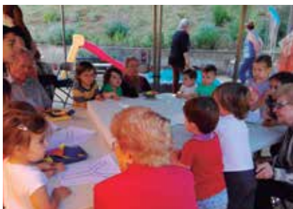
Taller intergeneracional i teatre de contes.

implicació i la col·laboració de les residències, centres escolars, entitats, comerços i moltes persones voluntàries del poble.