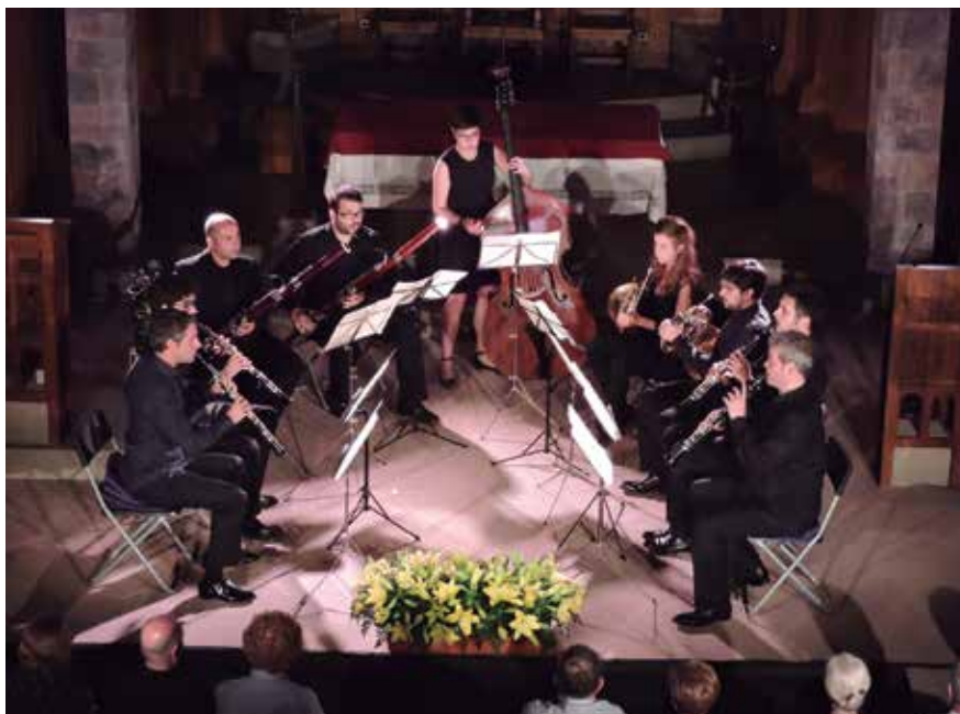
Les entrades dels dos concerts de Músics en Residència a l'Església es posaran a la venda a partir del 15 de juny.

I és que la proposta té un valor afegit molt important respecte a l'oferta de música clàssica que s'ofereix arreu de Catalunya: permet gaudir de formacions i interpretacions d'obres i autors molt difícils de trobar en les programacions habituals de música de cambra.