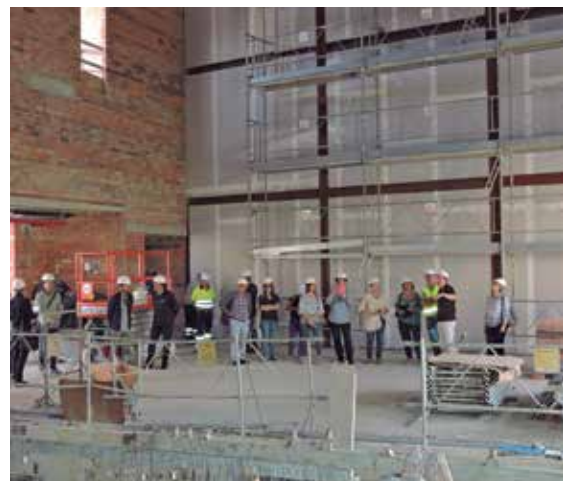
Visita d'obres dels regidors i regidores el 29 de maig.

Es podrà votar electrònicament, des de l'ordinador o qualsevol dispositiu mòbil, a través de la plataforma que estarà operativa del 8 al 19 de juny (a les 12h) des de www.alella.cat/trianom . Només caldrà facilitar el número de DNI, per verificar l'inclusió en el cens de votants, i el número de telèfon per rebre el codi que permetrà votar. Tam-