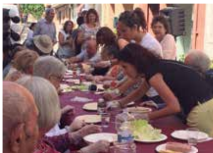
Creps i somriures i Dinar d'Homenatge a la Gent Gran.