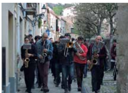
Orquestra Pamboli i recital Amb veu de dona.