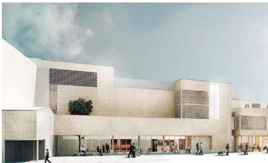
De l'11 al 19 de maig es poden presentar les propostes i del 8 al 18 de juny votar entre les cinc opcions seleccionades.

Es recomana que siguin noms fàcils de pronunciar, clars i entenedors, que no siguin diminutius i que tinguin alguna connotació que el vinculi amb el municipi i l'entorn. A més, també es demana que cadascuna de les opcions presentades s'acompanyi d'una breu explicació que justifiqui el nom proposat. Un jurat —format per representants del govern i de l'oposició, tècnics municipals i representants del Casal