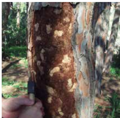
Imatge d'un dels pins morts a Cal Baró.

L'Ajuntament ha encarregat la tala d'una seixantena d'arbres morts o poc desenvolupats de dues pinedes de titularitat municipal a la zona del Bosquet i a Cal Baró. Es tracta d'exemplars que han mort o estan en molt mal estat per els efectes de la sequera, de la plaga de Tomicus destruens i també d'altres poc desenvolupats, ofegats i amb po-