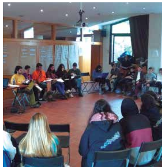
L'11 de febrer es va fer una jornada de participació.

Els treballs d'elaboració del Pla Local d'Adolescència i Joventut estan arribant a la seva etapa final. Acabada la fase de diagnòsi, l'equip redactor està ultimant l'elaboració del pla d'acció i comença a treballar en la fase d'avaluació. En el disseny de les accions s'ha comptat amb les opinions i suggeriments del jovent que es van recollir a la jornada de participació celebrada l'11 de febrer a Can Lleonart. A la trobada van participar una trentena de joves que van poder debatre i proposar accions en els eixos d'afirmació de la identitat personal, construcció de projectes vitals i participació en projectes col·lectius. Es preveu que el pla es pugui aprovar pel Ple municipal al mes de maig