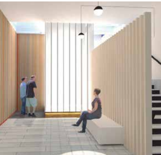
Imatge virtual del vestíbul d'entrada a l'Ajuntament.

L'Ajuntament ha posat fil a la agulla per tal de tirar endavant dues de les actuacions més destacades de l'any pel que fa a inversions: la reforma i adequació de l'edifici de l'Ajuntament i