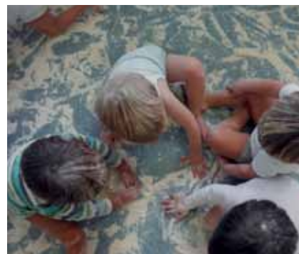
La llar d'infants municipal té capacitat per 61 alumnes.