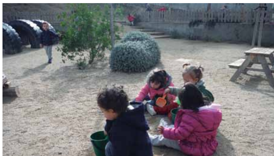
Els Pinyons preveu obrir els patis a les famílies amb infants de 0 a 6 anys els dies 12 d'abril, 11 de maig i 8 de juny.

La llar d'infants municipal Els Pinyons obrirà un cop al mes el pati del centre a les famílies amb infants de 0 a 6 anys perquè grans i petits puguin gaudir d'aquest espai en temps de primavera i compartir-lo amb altres famílies del municipi. Amb aquesta iniciativa, el centre