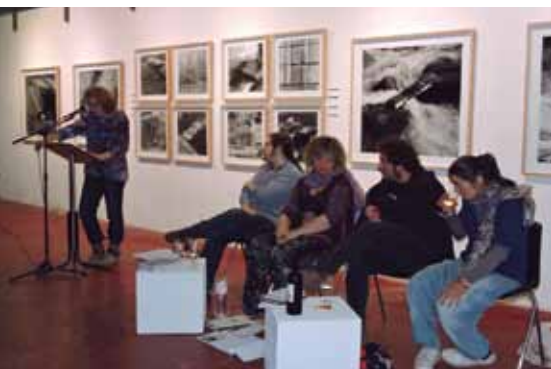
Recital poètic de l'edició anterior.

La 8a edició d'Espais de Poesia arriba del 5 al 15 de maig.