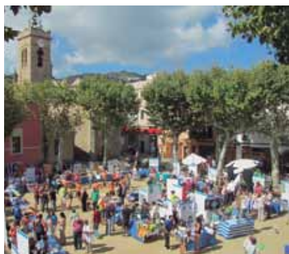
La iniciativa pretén promoure l'associacionisme.

La convocatòria es preveu obrir al maig, un cop superat el termini d'informació pública de les bases reguladores.