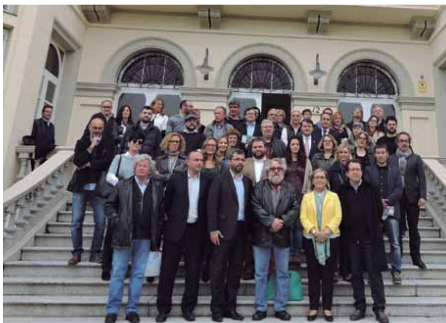
Alguns dels promotors públics i privats de la Ruta del Vi DO Alella després de la presentació a la Casa del Marquès.

Tècnicament, la Ruta del Vi és un producte complex que es tradueix en una xarxa de cooperació empresarial