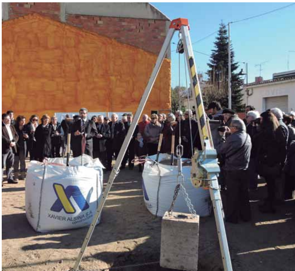
El 17 de gener es va posar la primera pedra del nou equipament cultural del carrer de Santa Madrona.

Per les seves dimensions i les seves característiques el nou espai cultural ha d'esdevenir un dels principals punts de trobada de la ciutadania. Està situat entre els carrers de Santa Ma-