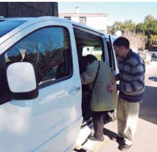
El servei va tancar l'any amb 143 usuaris i usuàries.

Els trajectes es van incrementar un 50% l'any 2015 amb prop de 3.500 viatges.