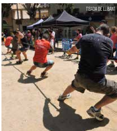
TIBADA DE LLIBANT