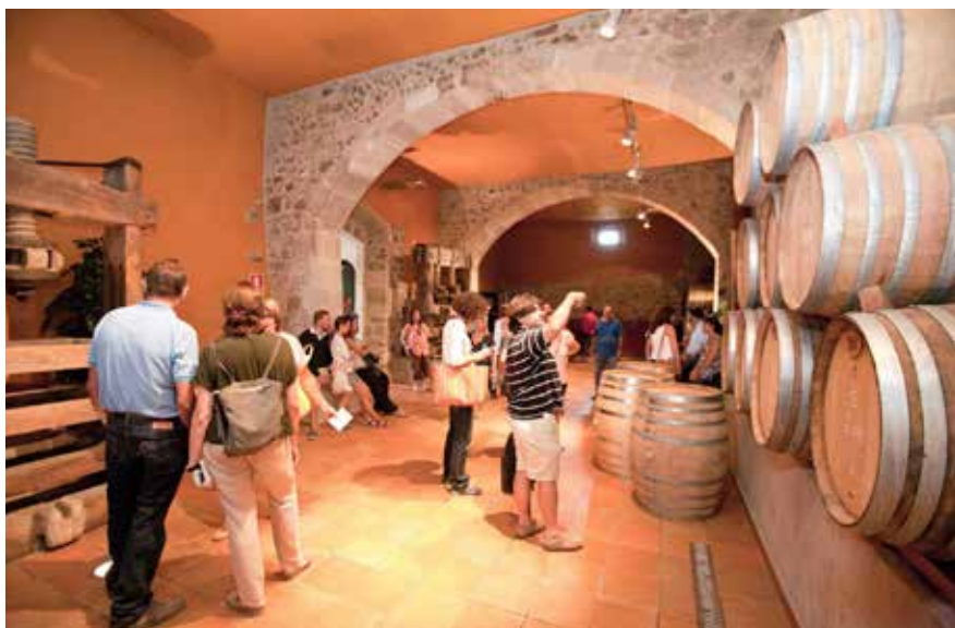
Els tiquets de la Mostra Gastronòmica es poden adquirir de forma anticipada des del 31 d'agost a l'Oficina de Turisme.

La 42a Festa de la Verema se celebra del 9 a l'11 de setembre, tot i que hi haurà activitats del 7 al 18.