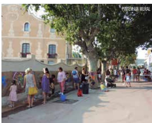
PINTEM UN MURAL