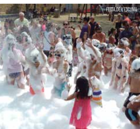
FESTA DE L'ESCUMA