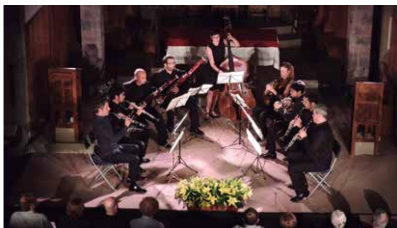
Els Músics en Residència van entusiasmar el públic en els concerts que van fer a l'Església.