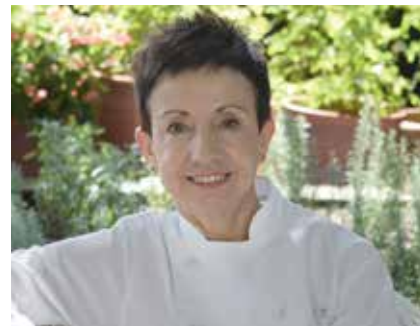
La cuinera Carme Ruscalleda donarà el tret de sortida del Vi+.

Aquest serà el punt de partida d'un programa que inclou prop de 90 activitats organitzades per promotors públics i privats en una vintena de municipis: Alella, Arenys de Munt, Argentona, Badalona, Barcelona, Cabrera de Mar, Cabriels, El Masnou, Llinars del Vallès, Martorelles, Montcada i Reixac, Montornès del Vallès, Premià de Mar, Santa Maria de Martorelles,