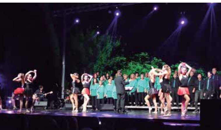
La Polifònica Joia i l'Escola de Dansa van fer tàndem als Jardins de Cal Marquès.