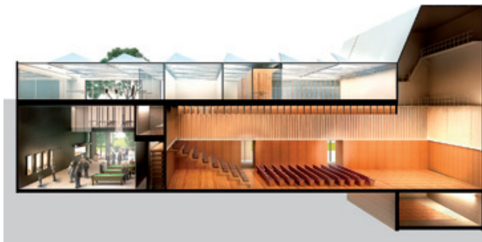
Dibuix del que serà el nou equipament cultural proposat per l'empresa Pol Femenias Arquitectes SLP.

Mentre es realitzen les obres es poden produir talls puntuals de la circulació de vehicles que estaran degudament senyalitzats. En tot moment