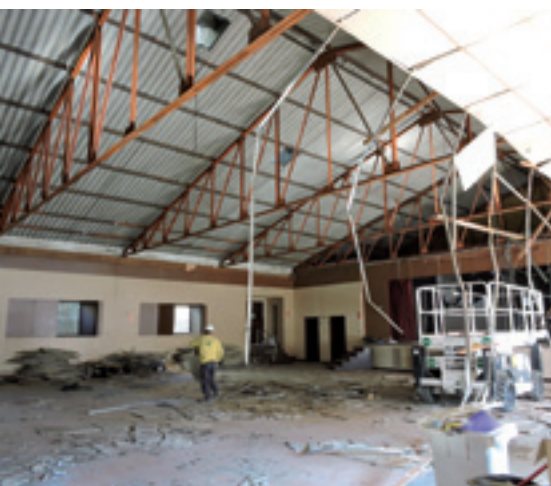
Les obres d'enderroc del Casal es van iniciar el 2 de març.

Comencen les obres d'enderroc de l'antic Casal d'Alella i l'Ajuntament adquireix el solar contigu per fer més gran el futur equipament.