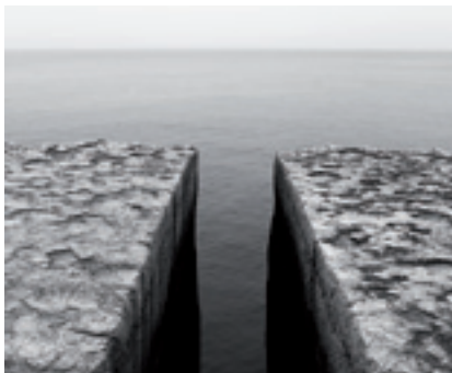
Imatge de l'exposició 'Mediterrània: pedra, sal, mar'