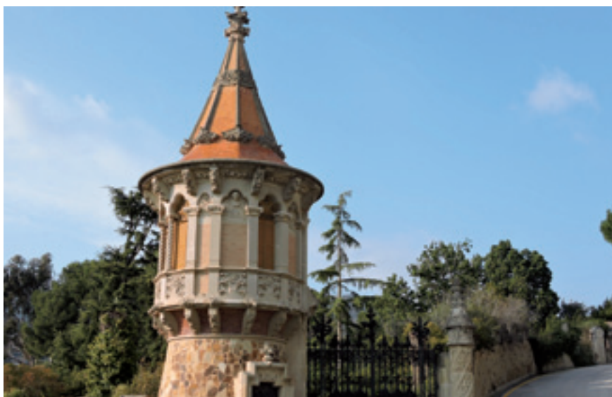
L'Ajuntament manté una opció de compra de la part dels jardins, el que suposa un 56% del sector.

Actualment hi ha un inversor interessat en desenvolupar un projecte hotelier de qualitat a la Torre del Governador que té des de fa mesos una opció de compra sobre la resta del sector, on es concentren els edificis, que està pendent de formalitzar. Aquest mateix inversor també ha arribat a un acord amb l'empresa Torrebarnades SL per adquirir en un termini màxim de tres mesos els gairebé 17.000 m 2 dels jar-