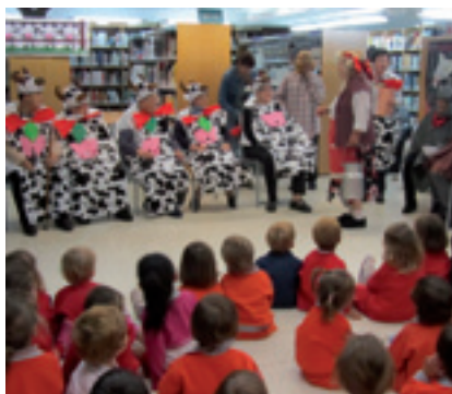
Teatre de contes dels avis i les àvies dels Rosers.