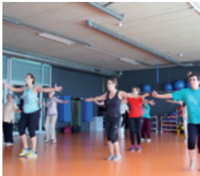
Classe de zumba al Complex Esportiu Municipal.