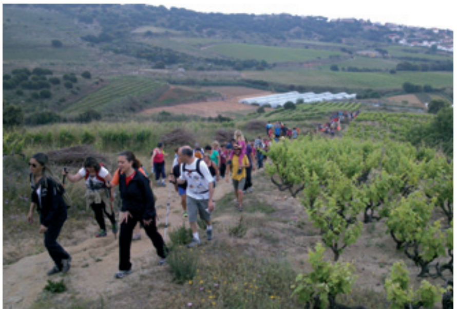
La Caminada dels Tres Pobles permet gaudir del paisatge de vinya dels tres pobles veïns.

La Caminada dels Tres Pobles segueix en forma. La passejada popular pel territori compartit dels pobles d'Alella, el Masnou i Teià va reunir en la seva setena edició un total de 1.254 caminants, tot i que s'havien arribat a