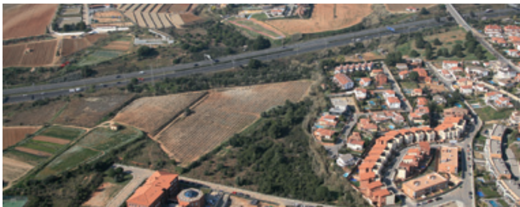
Imatge del nou sector urbanitzable de La Serreta-El Pla en el qual es construiran habitatges i una zona esportiva.

A més de preservar el paisatge, el POUM també pretén satisfer la demanda endògena d'habitatge i evitar que els joves i altres col·lectius hagin de marxar del municipi. Per això s'estableix una reserva de sostre per a la construcció d'un màxim de 608 habitatges, 231 dels quals seran protegits. Part dels nous habitatges —a l'entorn de 140— ja estaven programats en el planejament vigent i la resta procedeix del desenvolupament de polígons i sectors que estan qualificats com urbà (consolidat i no consolidat) en el planejament