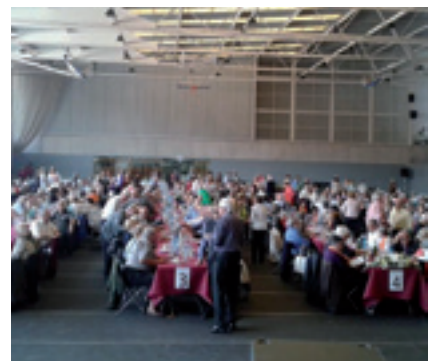
Dinar d'Homenatge a la Vellesa.