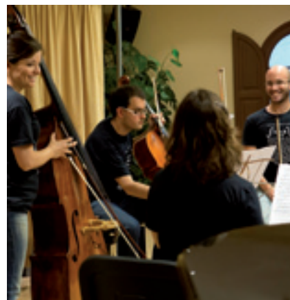
Músics en Residència: 17 i 19 de juliol a l'Església.