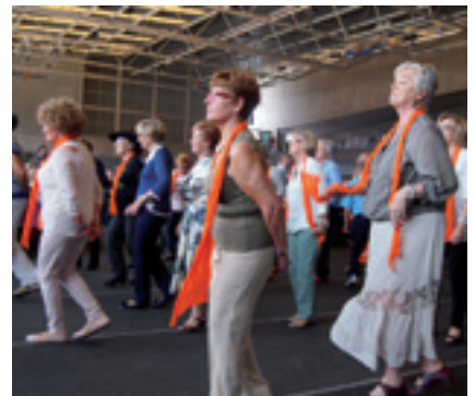
La flashmob de la gent gran.