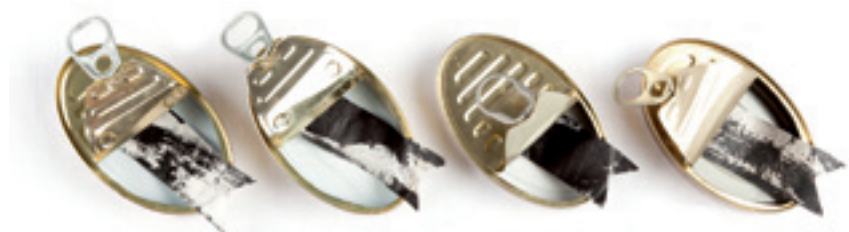
L'exposició inclou instal·lacions amb llaunes de conserves.

El treball de Carles Bros a "L'art de la teranyina" ha estat exposat a onze galeries de diferents països. Amb l'exposició l'artista ret homenatge a aquest sistema de pesca, tan mediter-