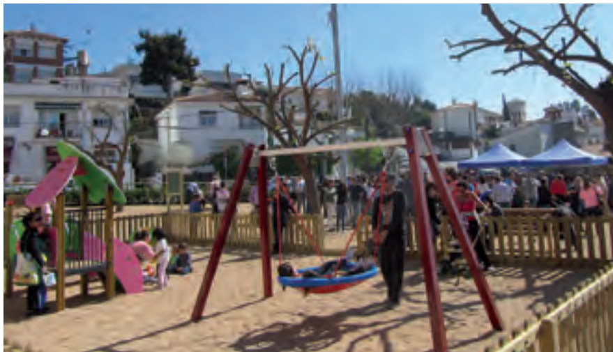
El Parc del Tricentenari es va inaugurar el passat 16 de març.

El barri de Can Sors va estrenar el passat 16 de març, un nou espai públic: el Parc del Tricentenari 1714-2014. El parc està situat a la cruïlla de la carretera BP-5002 i els carrers del Molí i de la Rosaleda. L'actuació ha permès dignificar aquesta part del barri amb l'adequació d'una parcel·la de 875 metres quadrats, que és propietat municipal des de finals de l'any 2012, i la reordenació de l'entorn.