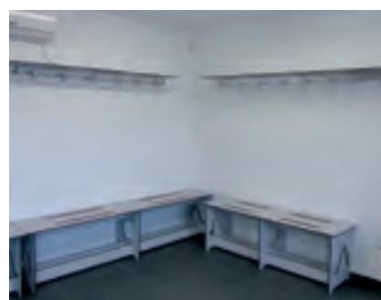
S'han instal·lat vestidors d'home i de dona.