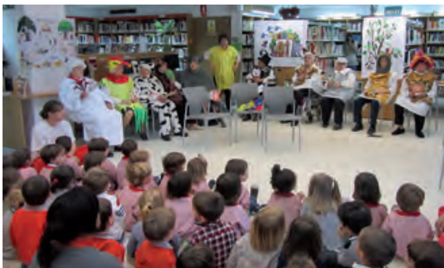
Els avis i àvies de la Residència Els Rosers faran una representació teatralitzada de contes a la Biblioteca.

Aprofitant el dinar d'homenatge, l'Ajuntament fa un reconeixement a les parelles que celebren les noces d'or. Els matrimonis d'Allella casats l'any 1964 que hi vulguin participar s'han d'inscriure al Casal de la Gent Gran Can Gaza abans del 25 d'abril.