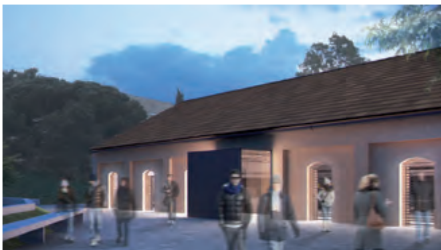
Imatge virtual d'un dels laterals de la Biblioteca.