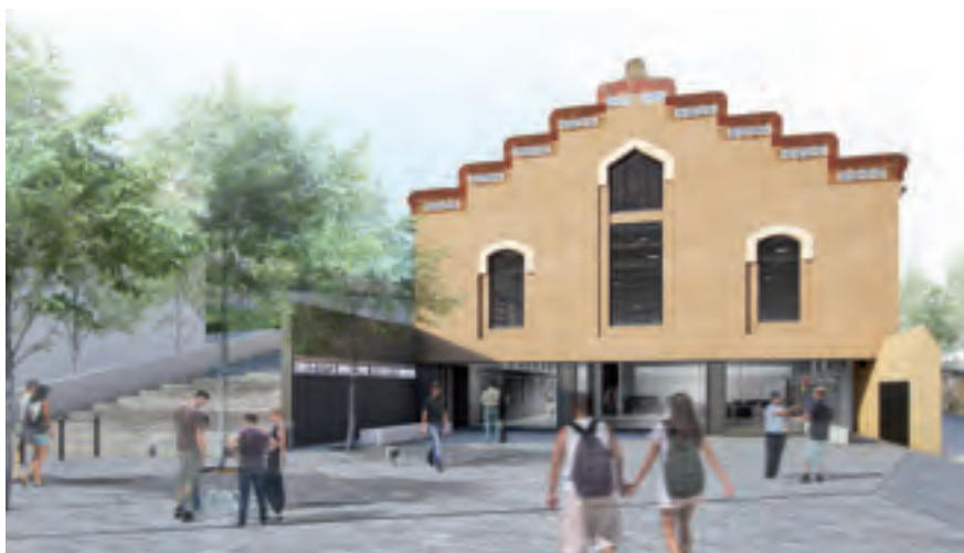
Imatge virtual de l'entrada principal de la Biblioteca.

La construcció de la Biblioteca i l'Arxiu suposarà una inversió de 3,3 milions d'euros, als quals caldrà afegir un milió més per a la dotació dels equipaments i la urbanització de l'entorn.