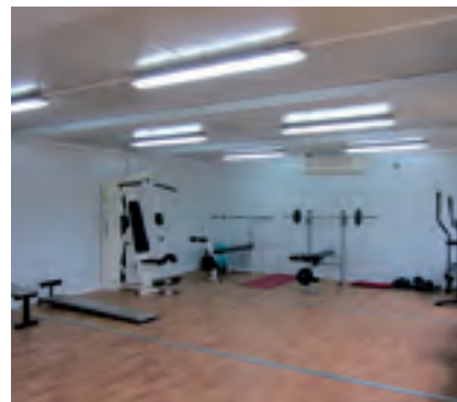
Interior dels mòduls prefabricats.

La pista d'entrenament d'atletisme d'Alella és l'única instal·lació esportiva d'aquestes característiques del Baix Maresme.