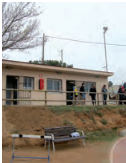
La caseta s'ha repintat i adequat per dins i per fora.

El 22 de març es van inaugurar les obres de remodelació i millora de les instal·lacions de les Pistes d'Entrenament d'Atletisme Josep Maria Pareras. La reforma parcial d'aquestes instal·lacions esportives, que gestiona el Club