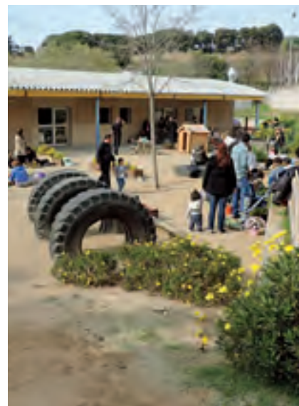
Els Pinyons obren portes el 26 d'abril.

Els Pinyons posa a disposició de les famílies un espai de trobada per compartir experiències. Les properes sessions del cafè de les tres seran el 24 d'abril i el 8 de maig. Cal confirmació prèvia.