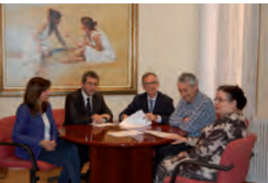
L'acord entre els dos ajuntaments es va signar el 18 de març.

Els tres ajuntaments compartiran un centre de suport a empreses i emprenedors.