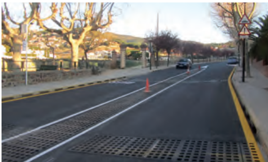
La Riera Coma Fosca es va obrir al trànsit el 15 de març després de tres mesos d'obres.

La Riera Coma Fosca es va obrir totalment al trànsit el 15 de març, un cop enllestits els treballs de pavimentació de la calçada. Les obres van obligar a restringir la circulació d'aquesta via, de manera intermitent, durant més de tres mesos, entre el giratori de Can Sans i l'avinguda Jaume Rius Fabra. Els treballs han comportat la renovació total de la pavimentació de 650 metres de Riera que estava molt deteriorada. Les obres han patit entrebancs en la seva realització que han incrementat l'afectació viària respecte a la planificació inicial. Al tancament d'aquesta edició d' El Full quedaven pendent de finalitzar els darrers treballs de millora.