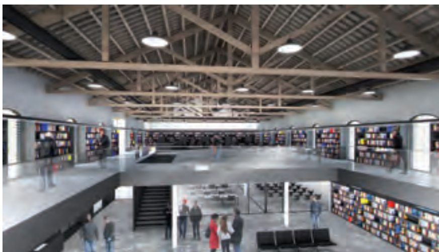
Imatge virtual de l'interior de la Biblioteca.