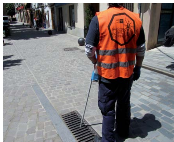
La primera dosis es va aplicar al mes de maig.

A més d'aquestes mesures preventives a la via pública, per lluitar contra la proliferació del mosquit cal que la població també tingui cura i compleixi les mesures preventives dins de l'àmbit privat. Bàsicament, i com a mesura més important, cal evitar l'acumulació d'aigua en exteriors que faciliti la cria dels insectes.