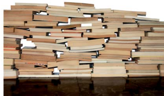
Una imatge de l'exposició 'Les restes del naufragi'.

Espriu també passarà pels Espais de Poesia, l'any del centenari del seu naixement. L'obra del poeta català serà present en algunes de les activitats organitzades, com ara al recital poètic programat a la inauguració de "Les restes del naufragi", l'instal·lació que J.M. Calleja ha preparat per a Can Manyé (el 12 d'abril a les 20.30h); l'espectacle poètic musical Sentint a la manera