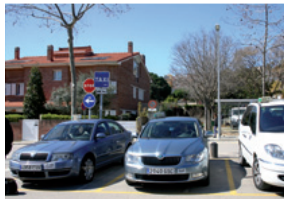
El servei de transport a demanda guanya usuaris cada any.

El servei és fruit d'un conveni de col·laboració signat amb els taxistes d'Ale-