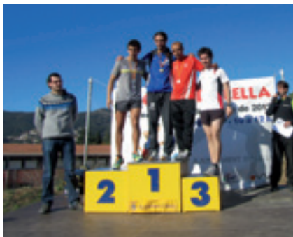
El pòdium de l'open masculí.

Els esportistes van posar a prova la seva velocitat i resistència en un recorregut habilitat pel Bosquet i els camins de la Vall de Rials. Cal destacar l'increment de participants de les categories inferiors, cosa que demostra l'interès dels més joves per aquest esport. A la