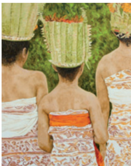
"Tiga Musisii", els tres músics, una de les obres exposades.

La mostra consta de 24 obres, la major part pictòriques, que recullen la llum i l'atmosfera que embolcalla la vida quotidiana de diferents personatges anònims d'aquesta illa de l'oceà