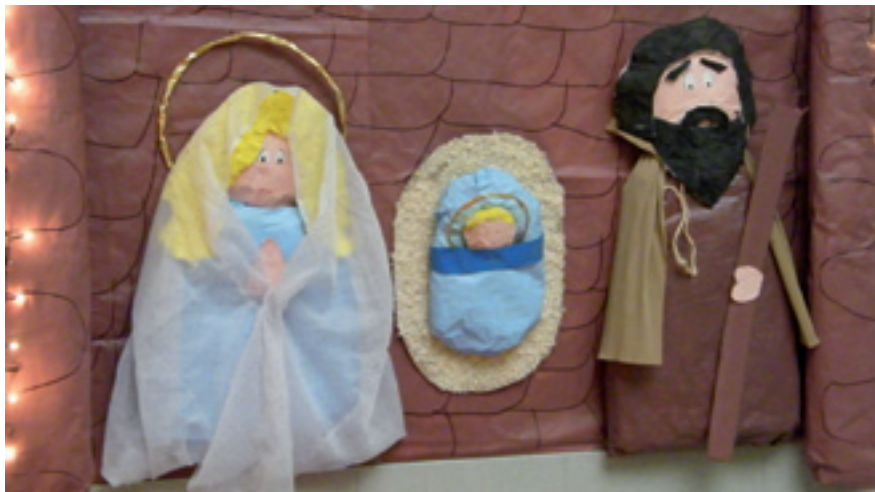
El pessebre de La Gavina, el primer premi de la categoria d'entitats.