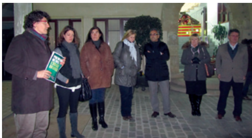
Imatge de la concentració en defensa de l'escola catalana que va tenir lloc el 10 de desembre davant de l'Ajuntament.

L'Ajuntament d'Alella es va afegir a les concentracions en defensa del model d'escola catalana i l'immersió lingüística promogudes per somescola.cat (entitat que aglutina entitats del món educatiu i civil) que es van fer a diferents municipis de Catalunya el passat 10 de desembre, com a resposta a l'esborrany de la nova llei LOMCE proposada pel Ministeri d'Educació.