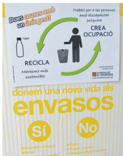
Un dels contenidors, ubicat a l'entrada de l'Ajuntament.

Dos d'ells són d'ús públic i estan col·locats a la recepció de l'Ajuntament i a l'entrada des de la plaça del Mercat Municipal. El tercer s'ha instal·lat en una dependència d'ús intern de l'Ajuntament. Els objectius principals d'aquesta iniciativa són oferir una activitat laboral als usuaris de la Fundació amb discapacitat intel·lectual a partir de tasques de recollida selectiva i transport de residus, així com contribuir a la sostenibilitat ambiental, tot apropant el reciclatge d'una fracció