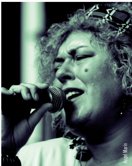
Big Mama & The Crazy Blues Band actuaran el 15 de febrer.

Les entrades es posen a la venda a partir de 4 de febrer a Can Lleonart.