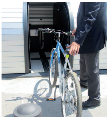
El nou sistema tarifari s'aplica des del mes de gener

L'Ajuntament ha establert convenis amb quatre empreses locals i comarcals per anunciar-se als mòduls publicitaris de la part posterior de les instal·lacions,