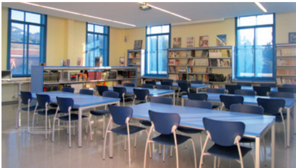
La biblioteca estrena nou mobiliari i s'ha reorganitzat l'espai amb l'objectiu de dinamitzar-lo.

Des de l'any 2009 es va establir un nou marc de col·laboració entre l'Ajuntament i els centres educatius públics i les seves respectives AMPA (Institut Alella, Escola Fabra i Escola la Serreta), per tal de concretar i enfortir la relació entre la comunitat educativa i el municipi i afavorir la implicació dels centres en la vida cultural del poble.