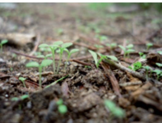
La foto guanyadora 'Brot de llum', de Griselda Roca Prats.

El passat divendres, 26 d'octubre, es va donar a conèixer el veredict del I Ral·li Fotogràfic organitzat pel Consorci del Parc de la Serralada Litoral. L'acte va tenir lloc a l'edifici de la casa municipal de cultura de La Unió, a Teià i va estar presidit per Rafael Ros, president