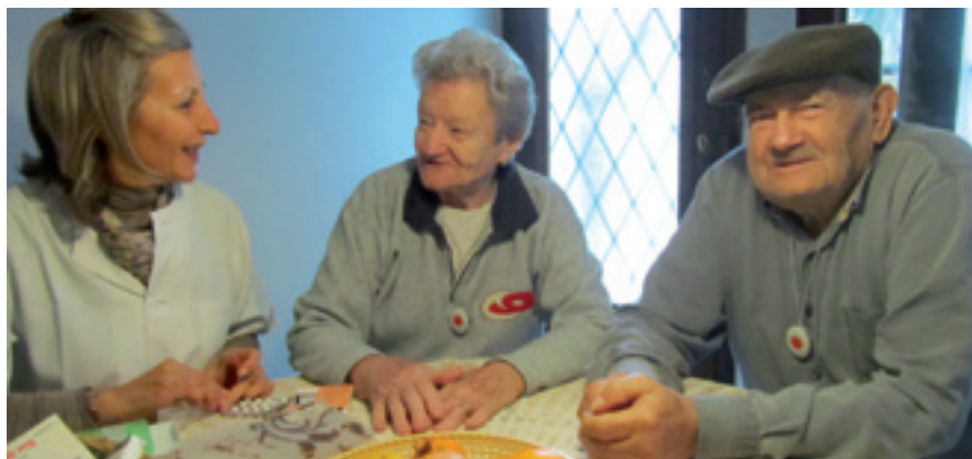
Una treballadora familiar a casa de dos dels usuaris del SAD

A diferència del que passarà a altres municipis, a Alella el servei seguirà sent gratuït per als usuaris, ja que el cost serà assumit per la Diputació de Barcelona i l'Ajuntament. Això pel que fa als 165 serveis de teleassistència