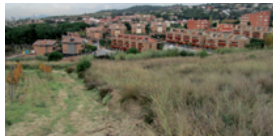
El sot del Marquès, un dels àmbits de les al·legacions.

La cinquena al·legació és una esmena al límit de protecció proposat, que no coincideix amb la trama urbana