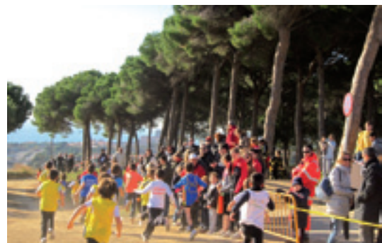
El Cros d'Allella va estrenar l'any passat nou circuit.

La prova allellenca és puntuable per al Cros Maresmenc 2012-13 i consta de recorreguts de diferents dificultats i distàncies adaptats a les diverses categories dels atletes que hi participen: pre-benjamí, benjamí, aleví, infantil i cadet, totes elles en les modalitats fe-