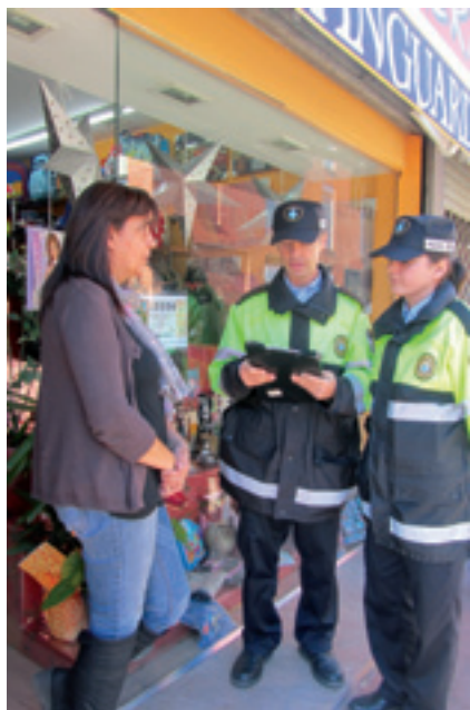
La campanya es farà del 3 de desembre al 5 de gener.

La Policia Local fa una campanya informativa per prevenir robatoris als comerços del 30 novembre al 5 de gener.