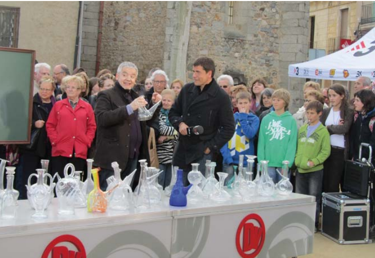
Els porrons del Casal d'Alella van acompanyar les 'Paraulas en Ruta' de Màrius Serra.

La Plaça de l'Ajuntament va ser l'escenari durant quatre dies de les connexions del programa de TV3.