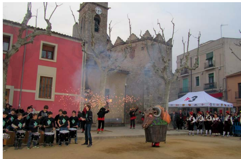
Fi de festa amb els Trabucaires del Vi d'Alella, els Diablers del Vi d'Alella i els Timbalers del Most.