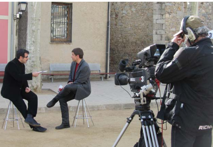
L'actor Abel Folk va fer d'ambaixador del poble, fent les seves recomanacions.