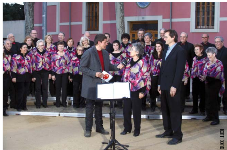
La Polifònica Joia es va 'atrevir' amb la sintonia del programa.