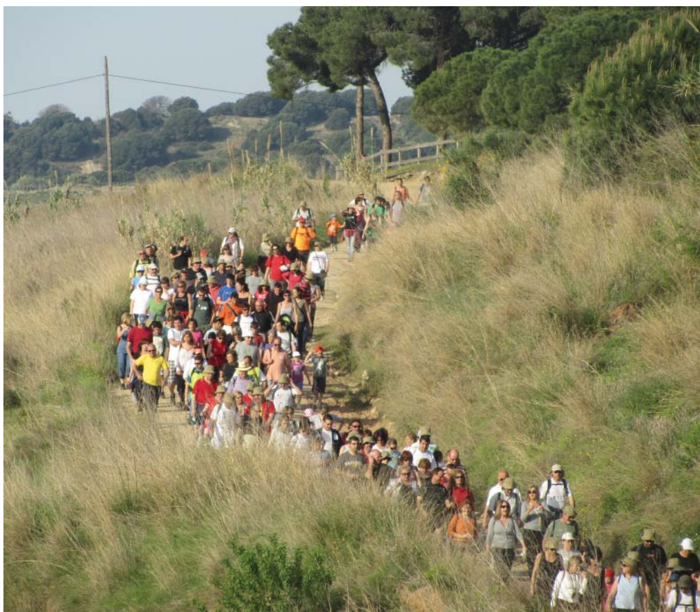
La caminada de l'any passat va aplegar més de 1.200 participants.

La caminada és gratuïta i oberta a tothom, grans i petits. Els menors de 14 anys hauran d'anar acompanyats d'una persona adulta i els joves d'entre 14 i 18 anys, que no vagin acompanyats, hauran de portar una autorització signada.