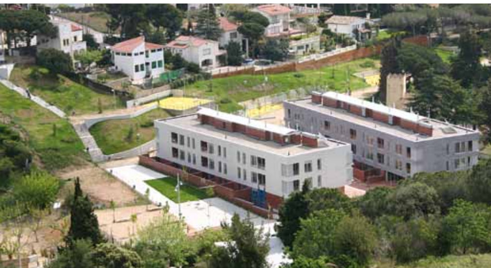
Els habitatges públics de lloguer de Cal Doctor es van acabar de construir a finals de 2010.

El procediment de comercialització obert per l'Incasòl queda desert per manca d'ofertes de compra.