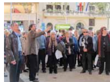
La gent gran d'Alella i de Bagà durant la visita