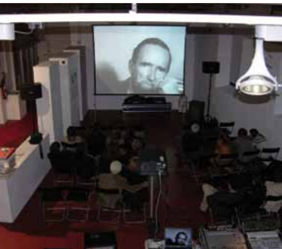
Els premis es van lliurar el 26 de novembre a Can Manyé.

Can Manyé va acollir el passat 26 de novembre la projecció dels curts finalistes i el lliurament de premis de la 12a edició del Vídeo Jove, el concurs de curtmetratges d'Alella. Els jurats de les dues categories -afecionats i professionals- van destacar la qualitat tècnica i artística dels curtmetratges presentats i van decidir concedir dos accèssits, un en la modalitat A de joves afecionats de 14 a 19 anys, i un altre en la modalitat de joves professionals.