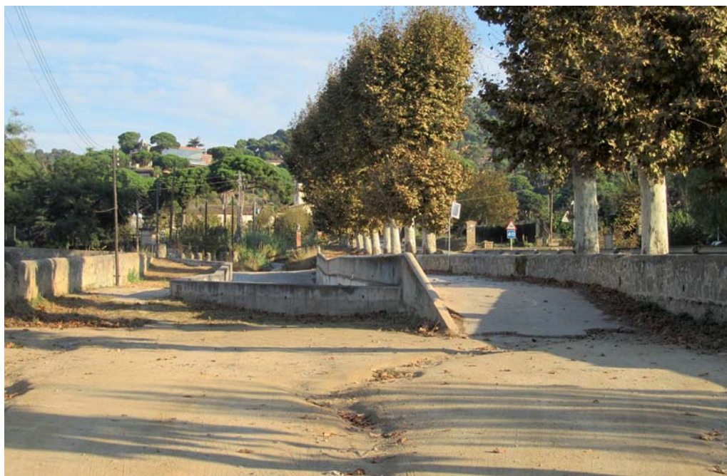
Tram de la riera, a l'alçada del pou sorrenc.

La reurbanització d'aquest tram de Riera segueix el mateix criteri de la primera part del passeig executada a mitjans de 2010 entre les Heures i Marià Estrada i té com a un dels principals