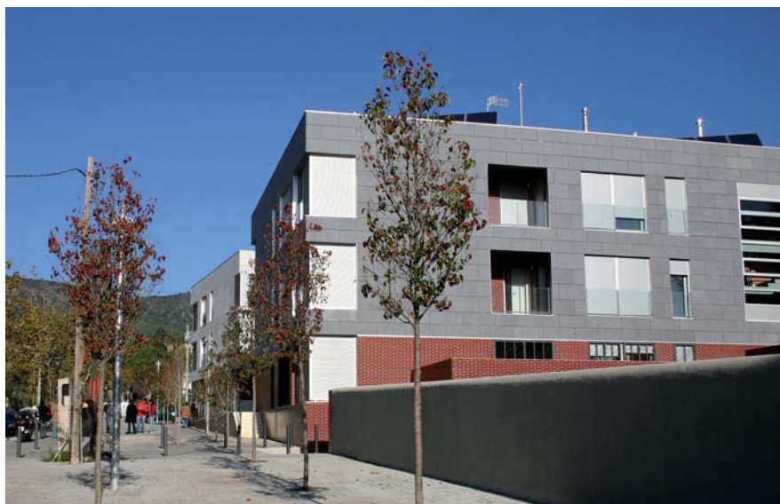
Els dos edificis d'habitatges socials de Cal Doctor.

L'Ajuntament s'oposa a aquesta mesura i estudia emprendre accions legals.