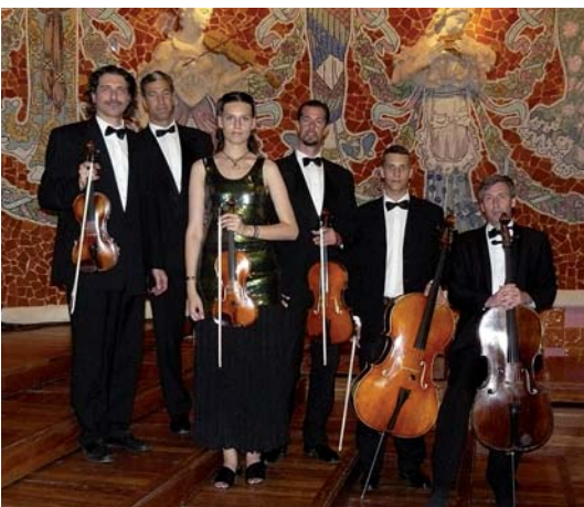
Ensemble Euroquartet, orquestra de cambra.

Les entrades dels concerts es poden adquirir a Can Lleonart.