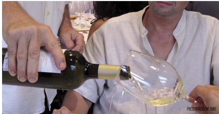
PRESENTACIÓ DE VINS