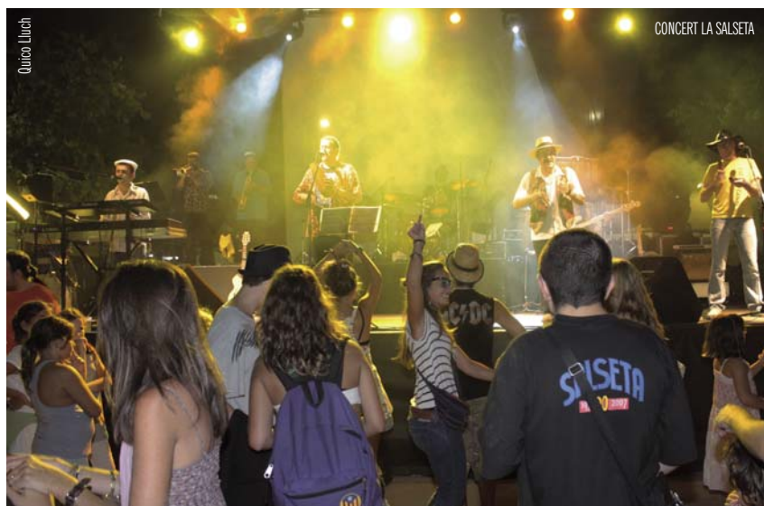
CONCERT LA SALSETA