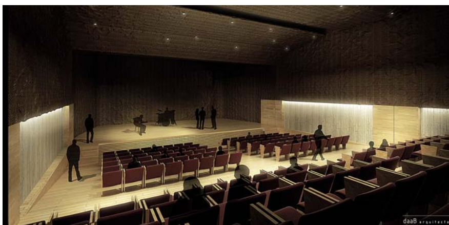
Imatge virtual de l'auditori del futur Casal.

Si es compleixen les previsions, l'Ajuntament té la voluntat de licitar les obres l'any vinent i treballa amb l'objectiu que el nou equipament públic pugui estar en funcionament l'any 2014.