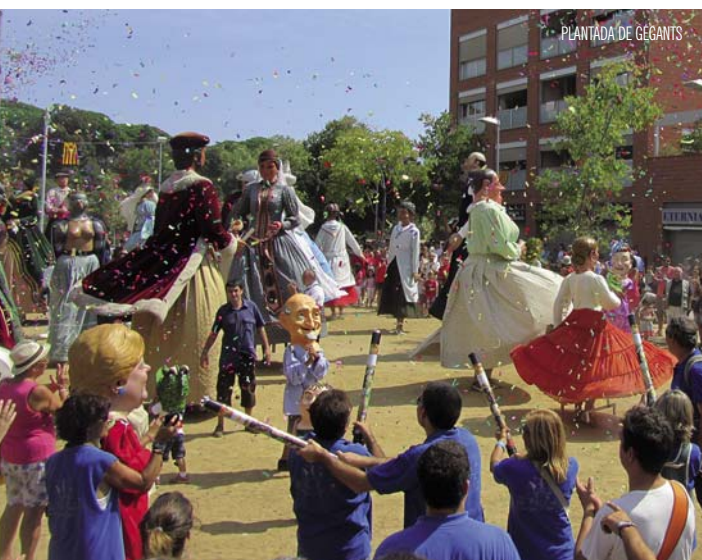
PLANTADA DE GEGANTS