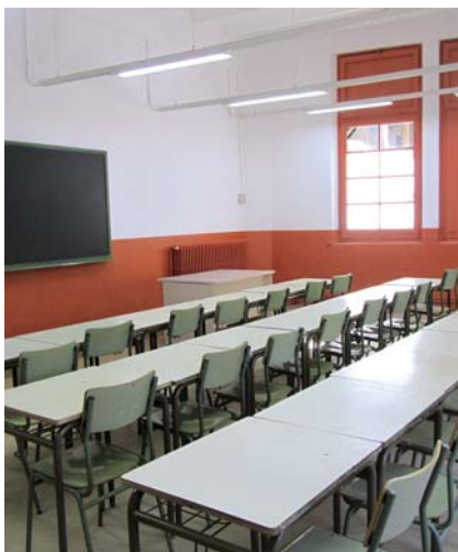
Les aules de l'Espai Actiu han estat repintades.

Els alumnes de l'Espai Actiu comencen les classes amb les aules recent pintades i disposaran aquest curs de suport informàtic.