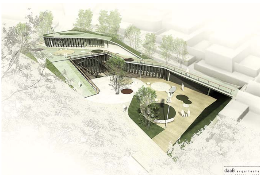
Vista aèria virtual del futur Casal.

La planta baixa es comunica amb la planta soterrani mitjançant l'espai polivalent que comparteixen les dues