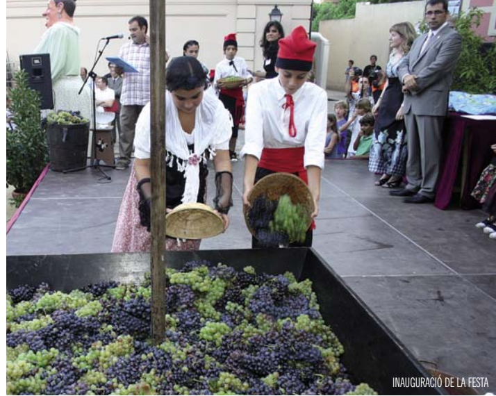
INAUGURACIÓ DE LA FESTA