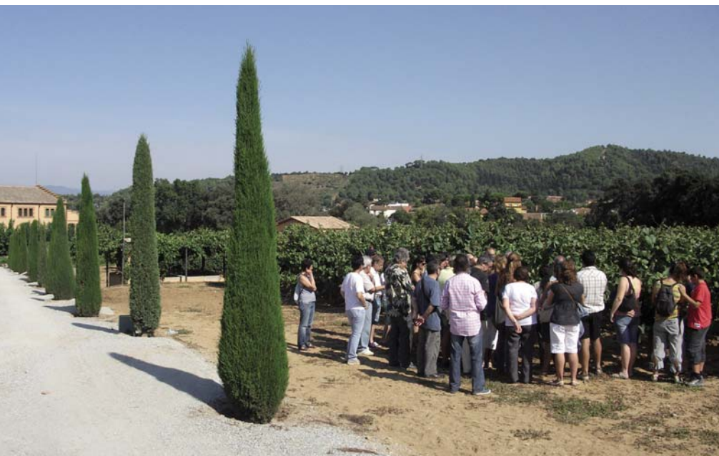
Imatge de la visita al celler Can Roda.

L'Ajuntament fa una valoració positiva de l'ampliació de l'espai de degustació i els canvis d'ubicació.