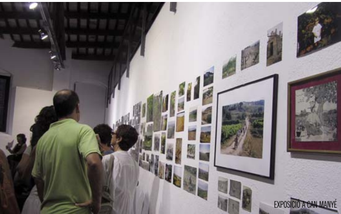
EXPOSICIÓ A CAN MANYÉ