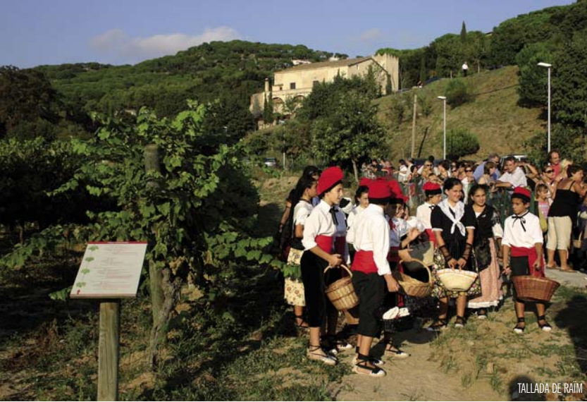
TALLADA DE RAÏM