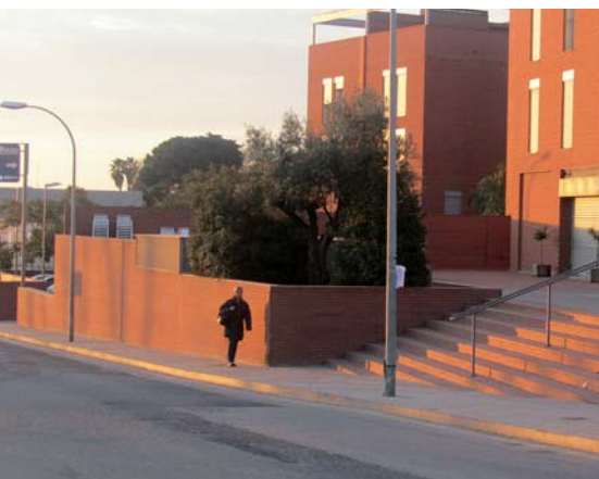
Les voreres s'aixamplaran per afavorir el passeig.

El projecte preveu ampliar les voreres i millorar l'accés i la seguretat dels vianants en el tram més transitat de la Riera Principal.