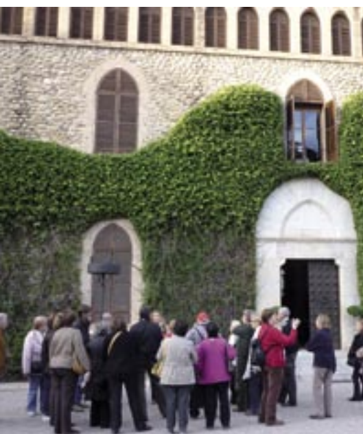
Can Leonart proposa tres sortides i dos itineraris.

L'11 de gener s'obren les inscripcions als cursos del primer trimestre.