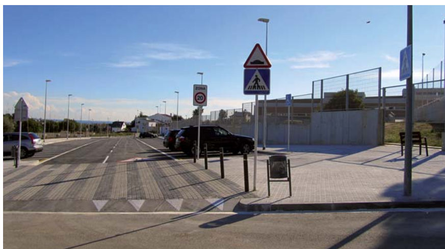
L'obertura del vial millora la connexió viària i incrementa la capacitat d'aparcament a la zona escolar de la Serreta.