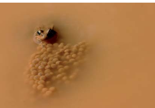
Premi a la Millor fotografia, de Pep Gener i Esteve.

Des del 2 de desembre les parets de Can Manyé són plenes d'imatges extraordinàries i sorprenents. Són les instantànies que componen l'exposició Instants de Natura, fotografies de la biodiversitat als Països Catalans, produïda per l'Associació per a la Defensa i l'Estudi de la Natura (ADENC). La