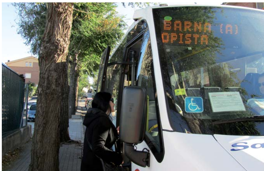
La nova línia dona servei als usuaris dels barris de Can Sors i Ibars Meia.

Des del 15 de novembre funciona una nova línia que uneix Alella, Teià i El Masnou amb Barcelona, amb parada a Ibars Meia i Can Sors.