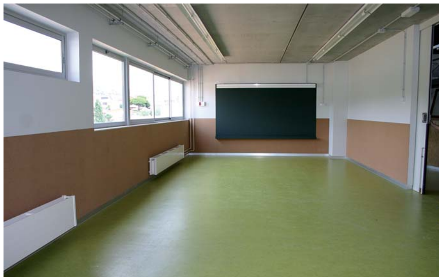
L'aula de psicomotricitat de l'edifici d'infantil que es posa en marxa el curs 2010-2011.

L'escola comença el curs amb una vuitantena d'alumnes de P3, P4, P5 i un intercycle de 1r i 2n de primària.