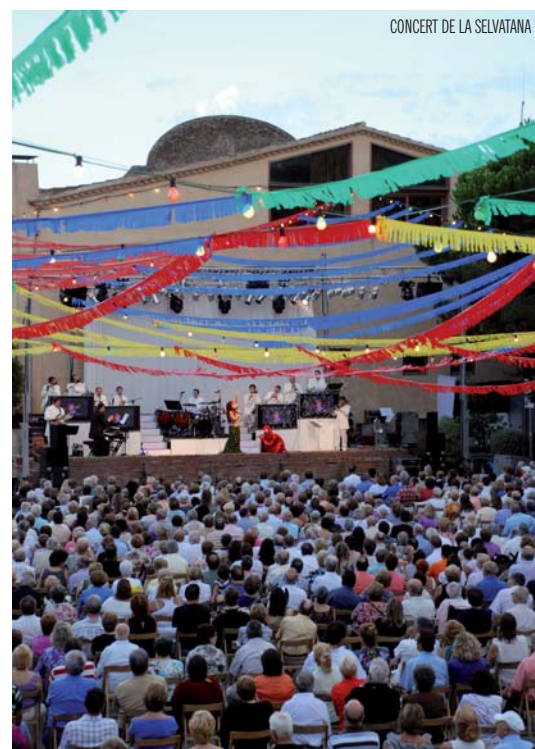
CONCERT DE LA SELVATANA