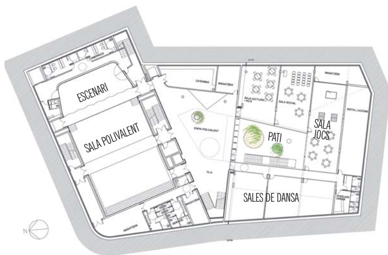
Plànol de la planta -1 de l'edifici del nou Casal d'Alella, projectat per daaB Arquitectes, slp.

S'ha elaborat d'acord amb la proposta guanyador del concurs d'idees.