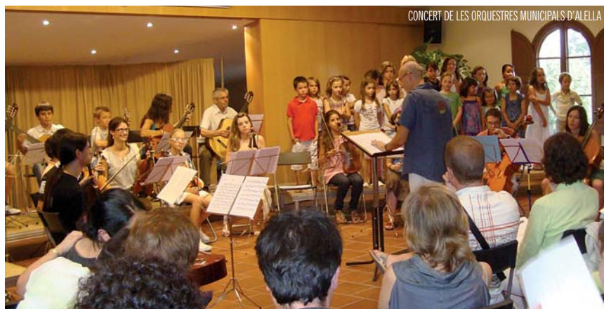
CONCERT DE LES ORQUESTRES MUNICIPALS D'ALELLA