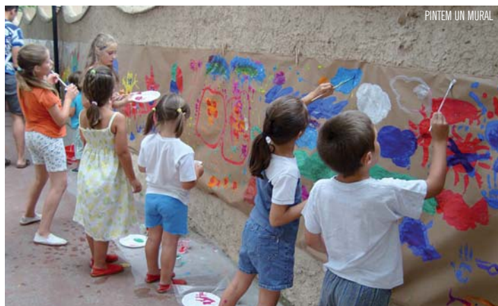
PINTEM UN MURAL