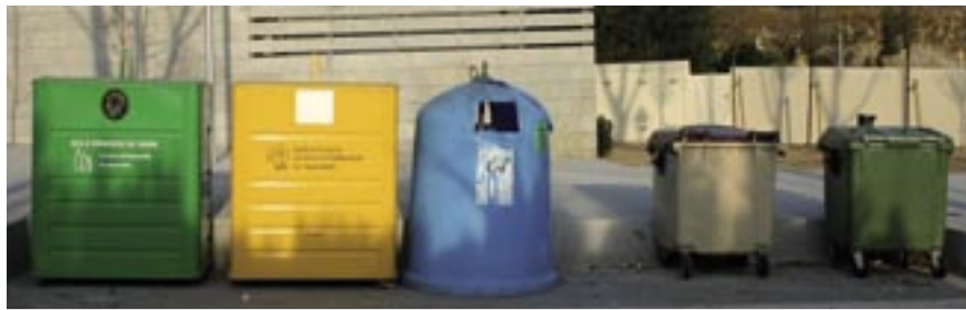
Vidre 227 tones Envasos 159 tones Paper 358 tones Orgànica 697 tones Rebuig 4.290 tones