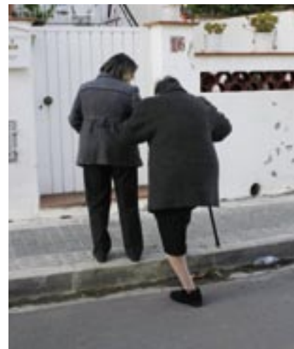
Les dones grans són les principals usuàries del SAD.

Més de la meitat dels 92 serveis prestats han estat d'atenció personal i cura de la llar. Les treballadores familiars han esmerçat en aquesta feina 5.677 hores per atendre les 55 persones que han requerit aquesta assistència. El servei d'ajut de neteja de la llar ha donat cobertura a 26 usuaris, amb un total de 907 hores treballades, mentre el que servei d'àpats a domicili ha beneficiat 11 persones i ha suposat 3.035 hores de treball.