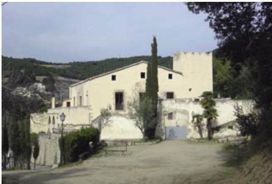
Les obres estan encaminades a millorar l'accessibilitat, garantir la conservació i evitar-ne el deteriorament.

La intervenció permetrà adequar espais funcionals amb accessos independents.