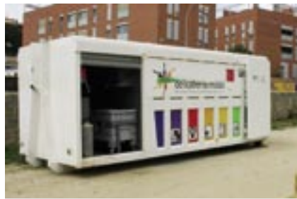
Deixalleries 597 tones

Durant l'any passat es van recollir un total de 6.328 tones de residus de totes les fraccions, de les quals 2.038 tones es van recollir de forma selectiva. Aquestes xifres situen en més d'un 32% el percentatge residus recollits selectivament.