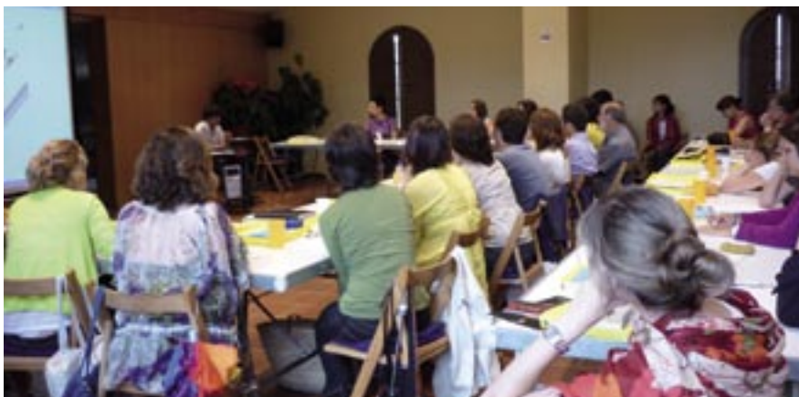
La cuinera Carme Ruscalleda va parlar sobre la relació del vi i la gastronomia.

Ha estat una setmana intensa en què els assistents han pogut gaudir de les xerrades de professionals de primer nivell que es dediquen a investigar so-