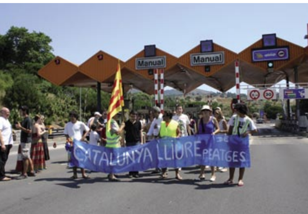
La mobilització es va desenvolupar en to festiu i va acabar amb un aperitiu davant de l'estació de peatge.

Els conductors van accedir gratuïtament al peatge durant mitja hora.