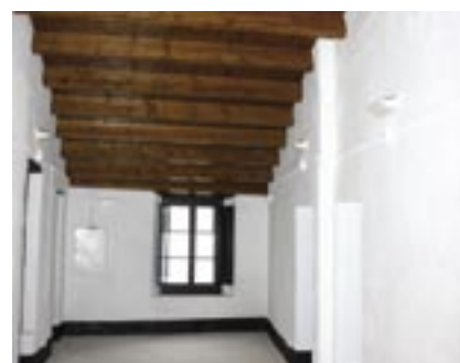
S'ha reconstruït el sostre i els forjats de part de l'edifici.