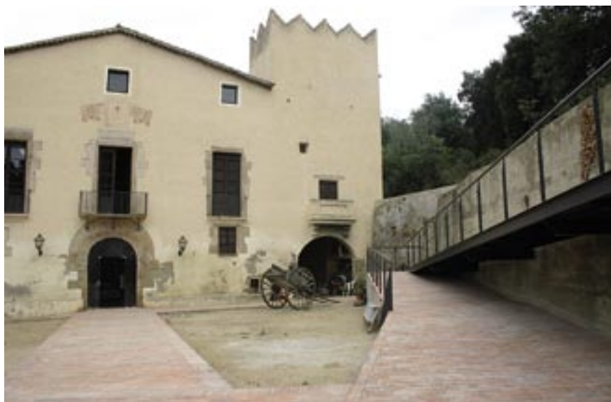
S'ha reforçat el pati d'accés com a punt d'acollida d'usuaris i visitants.

A aquest efecte s'han habilitat dos recorreguts d'accés a través de sengles rampes i s'han dotat aquests espais de serveis. La primera planta acollirà, a partir de setembre, les aules de pràctiques dels estudis de grau superior de Gestió comercial i màrqueting enològic. S'hi podrà accedir tant per una entrada independent situada en l'extrem superior de la finca, com des de la rampa habilitada al pati central. També s'ha adequat l'espai exterior amb voravies de maó, il·luminació i baranes per tal d'afavorir la realització d'activitats a l'aire lliure.