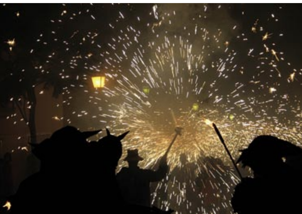
Els Diablers del Vi rebran la Medalla d'Alella, en grau de plata, pels seus 25 anys d'existència.

La Festa Major de Sant Feliu convida la ciutadania a fer poble i a compartir tres dies de gresca i celebració.