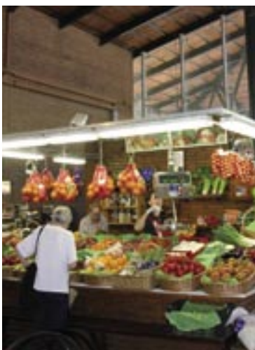
La festa d'aniversari es farà el dissabte 26 de juliol.

El Mercat Municipal d'Alella celebra aquest any el seu 25 aniversari de servei comercial al municipi. Per commemorar el quart de segle d'existència els paradistes estan preparant un acte de celebració previst per al dissabte 26 de juliol al qual està convidada a participar tota la població. Al tancament d'aquesta edició s'estava acabant de concretar el contingut de la festa, en la qual s'oferirà un refrigeri a tots els assistents.