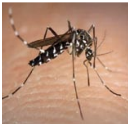
El mosquit tigre és petit, negre i té unes ratlles blanques al seu cos i a les potes.

- Buidar regularment o retirar qualsevol