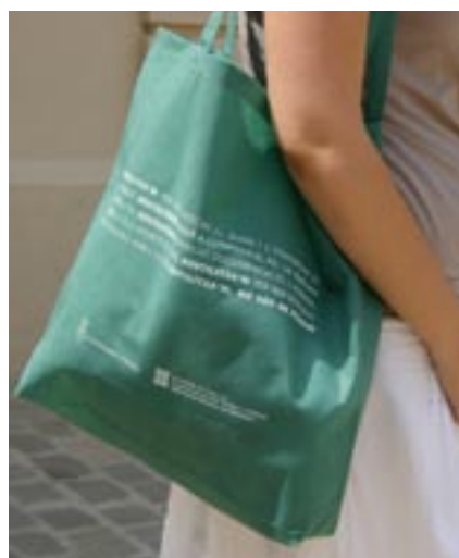
Les bosses de ràfia són una bona alternativa al plàstic.

L'Ajuntament ha acordat sumar-se a la campanya Catalunya lliure de bosses de plàstic promoguda per la Fundació per a la Prevenció dels Residus i el Consum Responsable.