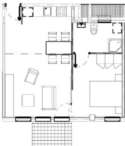
Tipus A, amb un dormitori.