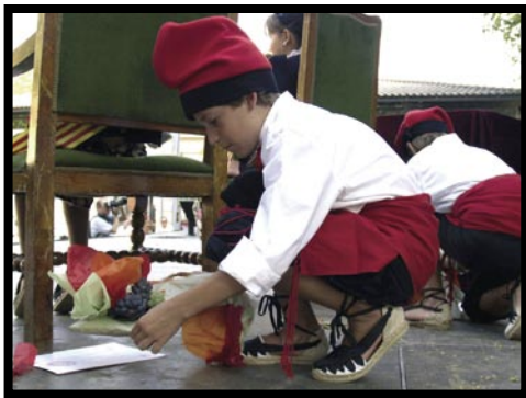
El Primer Premi, per Eduard Mauri Moncada.