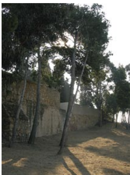
En aquest indret s'ha retirat un dipòsit d'aigua fora d'ús.

nou sauló en els passadissos i treballs de pintura.