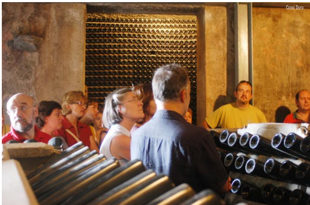
La visita als cellers és un reclam turístic, fet comprovat en la darrera Festa de la Verema.

La proposta vol aconseguir un turisme de qualitat, planificat i ben gestionat des del principi, d'alt valor afegit per a la població, especialitzat i diferenciat de la competència i sense posar en perill l'equilibri i harmonia actual del territori. El model turístic que es vol aconseguir es basa en un creixement limitat, controlat i planificat de les places d'allotjament. Alella ha de potenciar un turisme especialitzat al voltant de la vinya i el vi, elements històrics de la població que continuen marcant la imatge del municipi, la seva cultura i