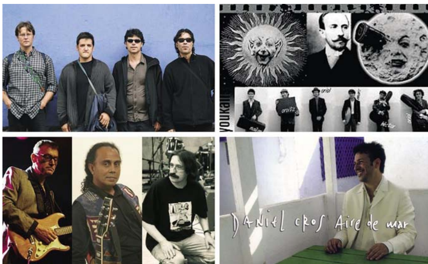
Quatre concerts amb molt de ritme per als mesos de febrer i març a les Golfes.

Música, actuacions infantils, tertúlies, cursos i tallers centren la programació.